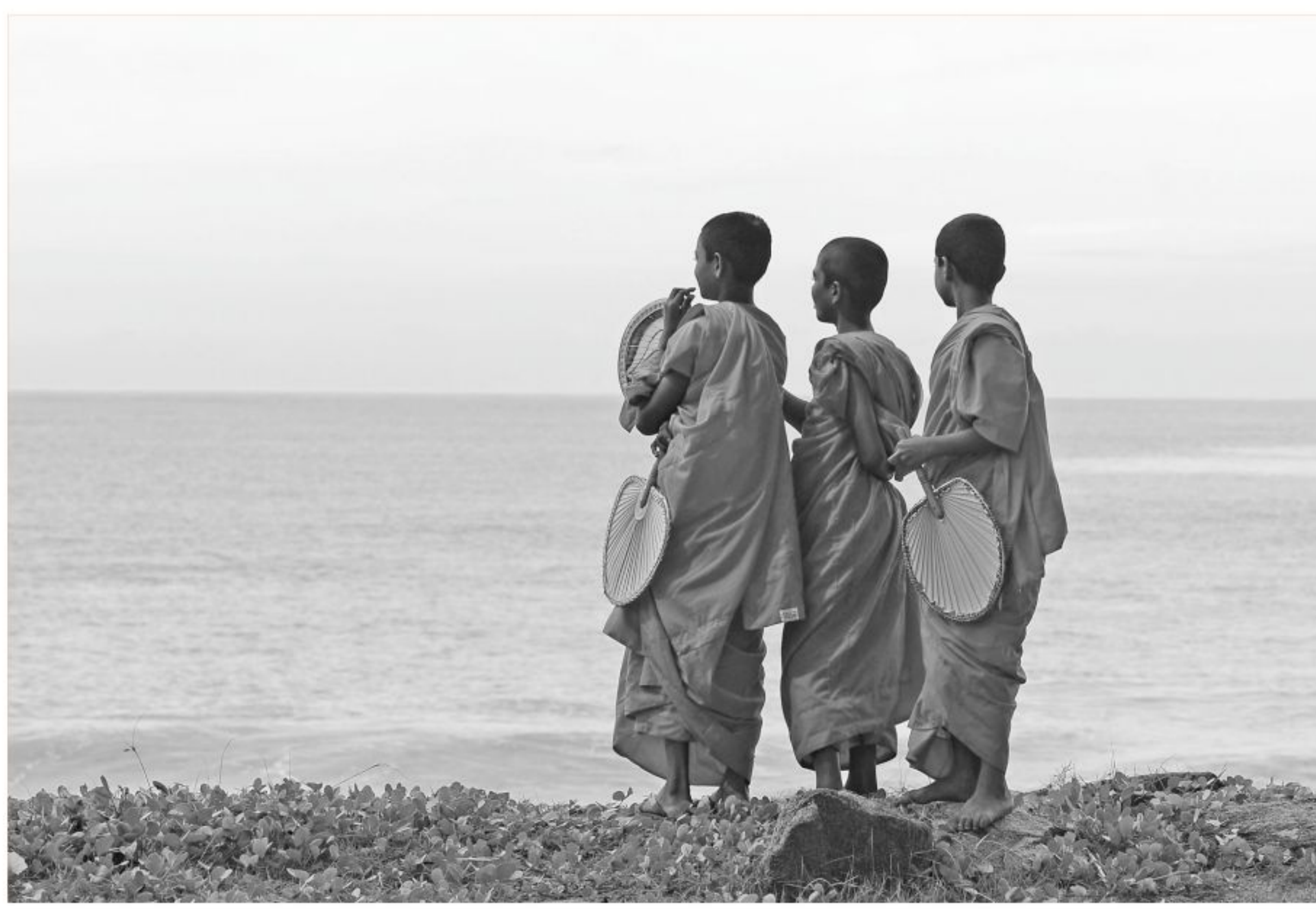
Young Sri Lankan Buddhist monks look on from the beach at Peraliya village in southern Sri Lanka yesterday on the eighth anniversary of the Asian tsunami. Some 31,000 people on the island died during the 2004 Asian tsunami and one million were initially left homeless.

a suicide car bombing. Camp Chapman lies on the edge of Khost city, which has been hit by at least three major suicide attacks this year. "Three Afghan nationals are killed and seven Afghan nationals are wounded. We have no report of coalition casualties right now," said Major Martin O'Donnell, a spokesman for Nato's International Security Assistance Force (ISAF). The Taliban claimed responsibility for the attack. They have waged a bloody insurgency against foreign and Afghan forces since being ousted from power in a 2001 invasion led by the United States. Khost province borders Pakistan, which is widely believed to be a key source of fighters, funds and supplies for the Taliban. The Haqqani network, a militant group close to al-Qaeda and blamed for some of the most daring insurgent attacks in Afghanistan, is particularly active in the province.