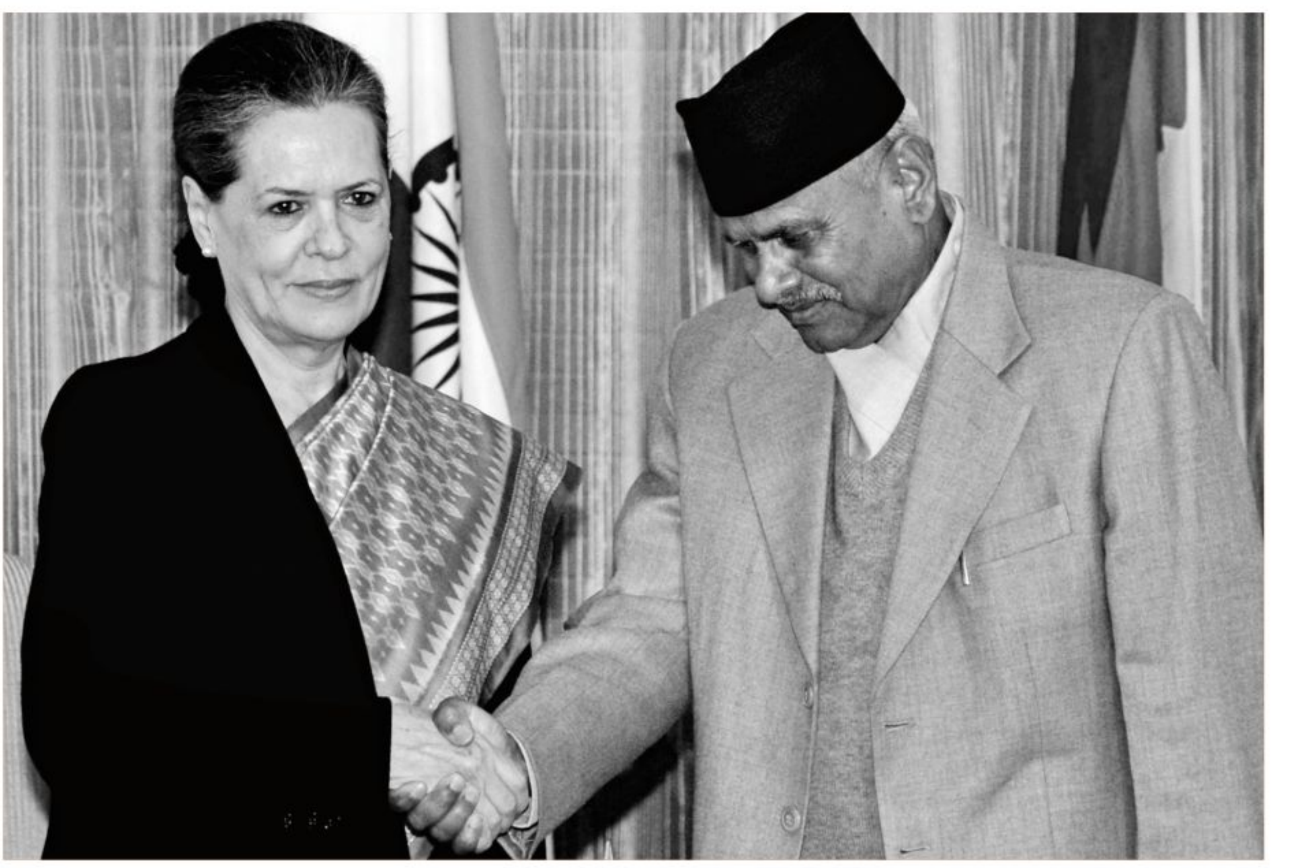
Nepal President Ram Baran Yadav, right, shakes hands with Sonia Gandhi, chairperson of India's ruling coalition UPA, during a meeting in New Delhi yesterday. Yadav is in India for a six-day official visit.

AFP, Kuala Lumpur Floods triggered by torrential monsoon rains in Malaysia forced almost 14,000 people to flee their homes and seek shelter at relief centres, the official Bernama news agency said yesterday. Heavy rain coinciding with high tide flooded hundreds of homes in three northeastern states -- Terengganu, Pahang and Kelantan -- with some 13,746 people moved to evacuation centres, it said amid forecasts of more downpours. Bernama said the flood situation was deteriorating as the number of evacuees continued to rise and some major roads in Pahang were closed as rivers burst their banks. Muhammad Helmi Abdullah, the meteorological department's weather forecast director, warned that there could be more rain in Terengganu, Pahang and southern Johor state in the next few days.