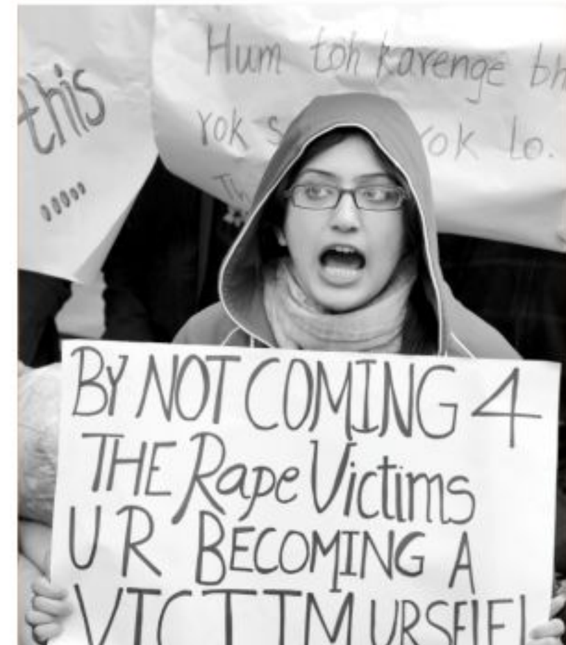
A protester decries violent crimes against women in India