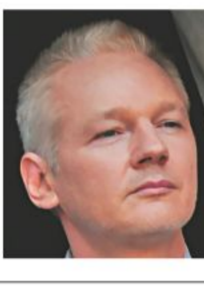
SEE PAGE 19 COL 2

AGENCIES Julian Assange has said WikiLeaks is preparing to publish 1m new secret government documents as he marked six months of refuge in the Ecuadorean embassy in London with a speech from its balcony on Thursday. The WikiLeaks founder has remained in the embassy to avoid arrest and extradition to Sweden on suspicion of sexual offences.