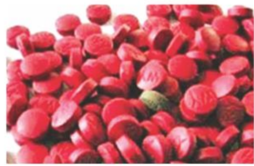
Yaba has also increased its demand manifold. The smugglers and peddlers seem unstoppable. Law enforcers said most of the offenders get bail within

TAREK MAHMUD, Ctg Yaba, the noxious amphetamine based drug, has flooded the port city, enticing youths into the deadly addiction. Within the last few months, law enforcement agencies have almost every day captured one or more people with a huge number of Yaba tablets. The extent of youths' Yaba addiction throughout the port city indicates rampant peddling of the drug, said police sources. The recent drop in street value of