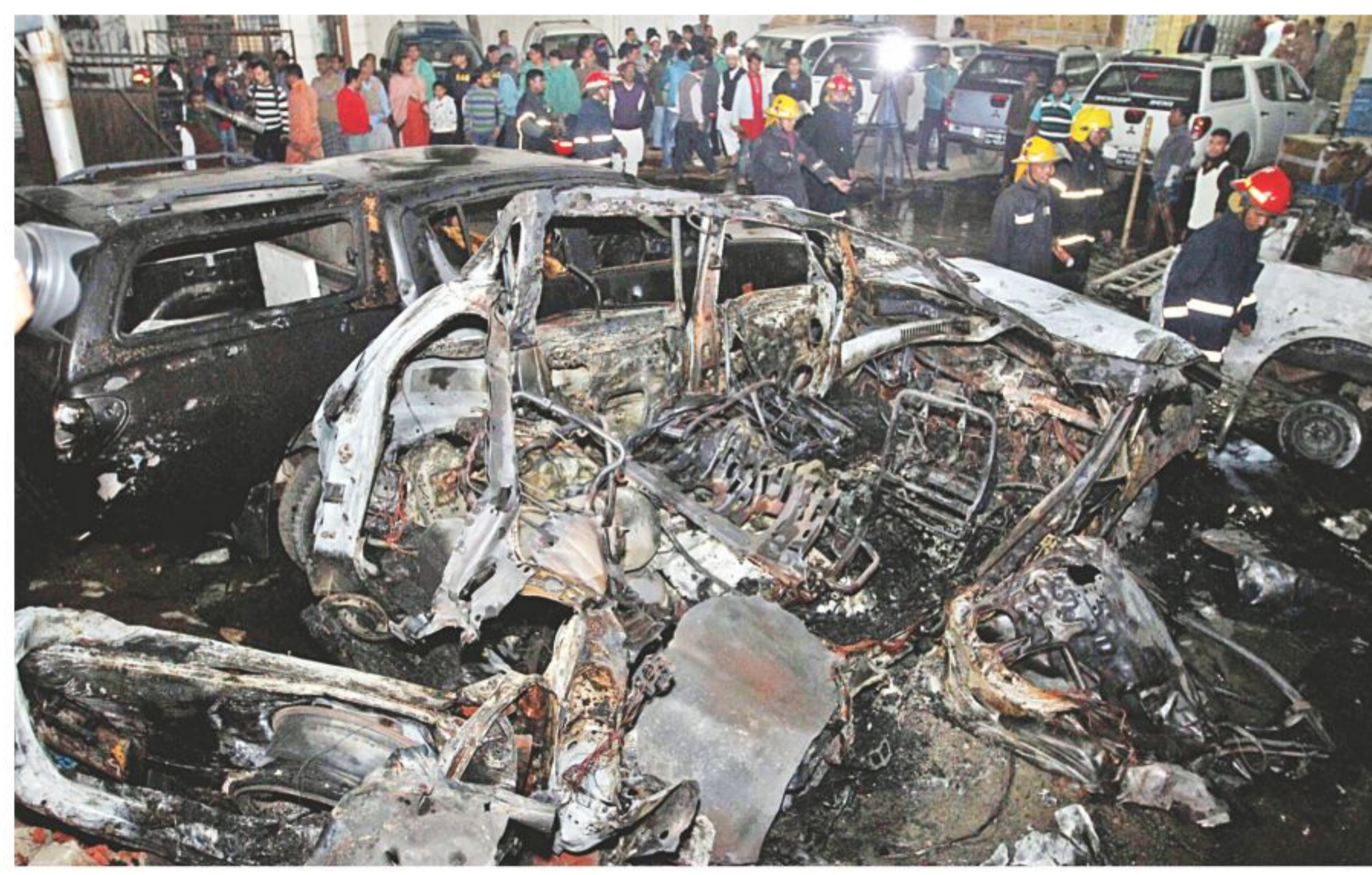
Gas cylinder explosion leaves three private cars hardly recognisable at a parking at Mohakhali in the capital yesterday. No casualty was reported but the blast damaged windowpanes of some adjacent buildings.