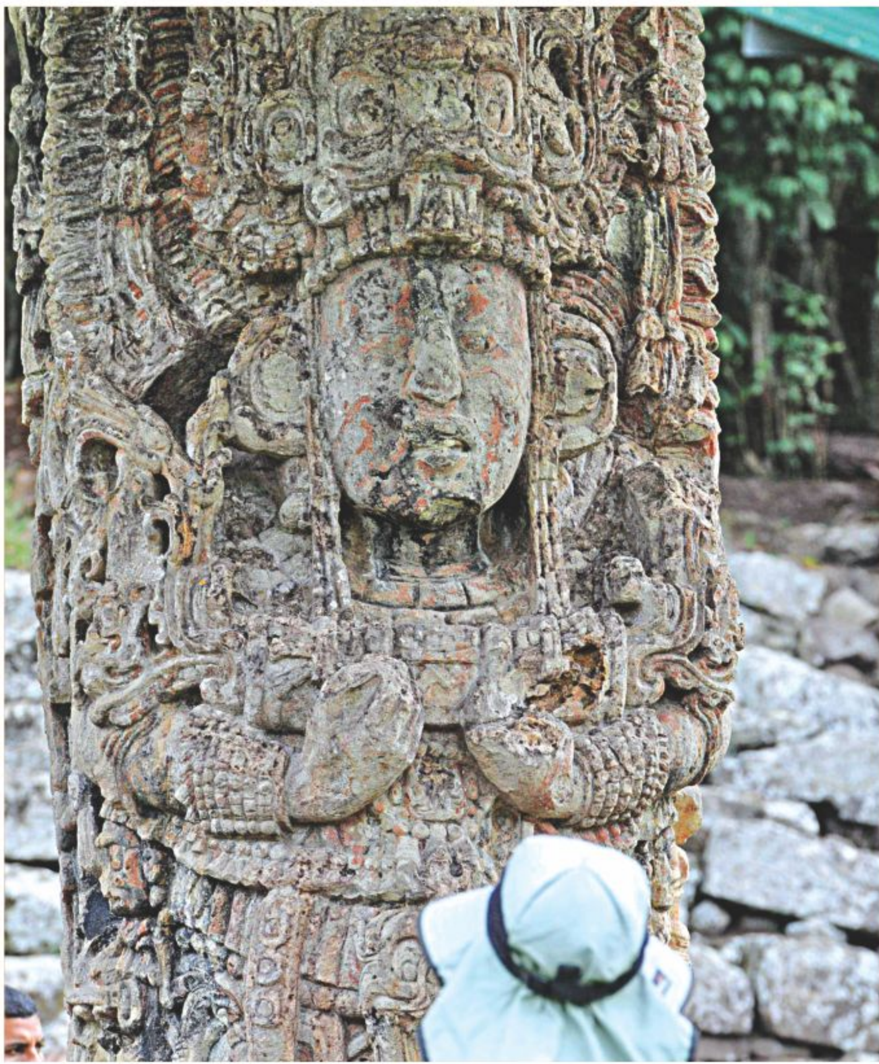
A tourist looks at a Mayan stele at the Copan archaeological park in Honduras on Wednesday. Honduras is one of five countries preparing to celebrate today, the end of the Maya Long Count Calendar -- Baktun 13 -- which began in 3114 BC.

It is the fifth kitchen market to be declared free from formalin and carbide SEE PAGE 19 COL 5