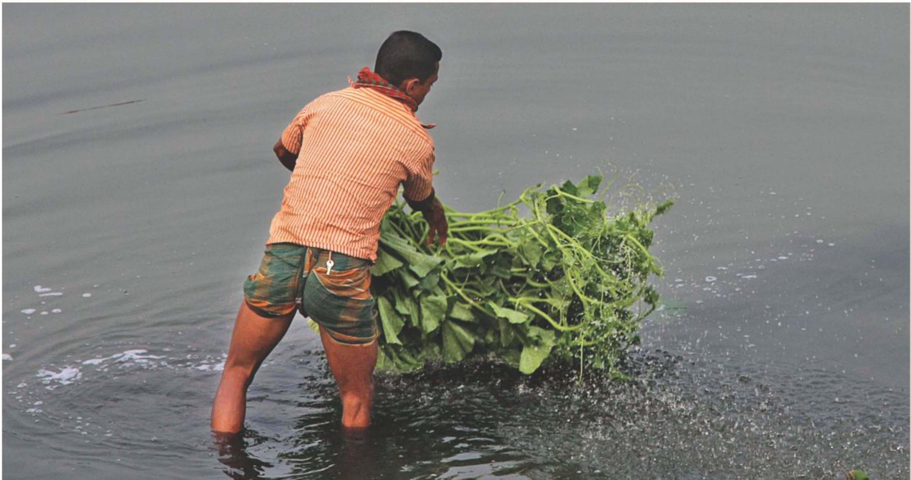
A trader washes vegetables in dirty water of a canal at the capital's Manda before taking those to market. The photo was shot recently.