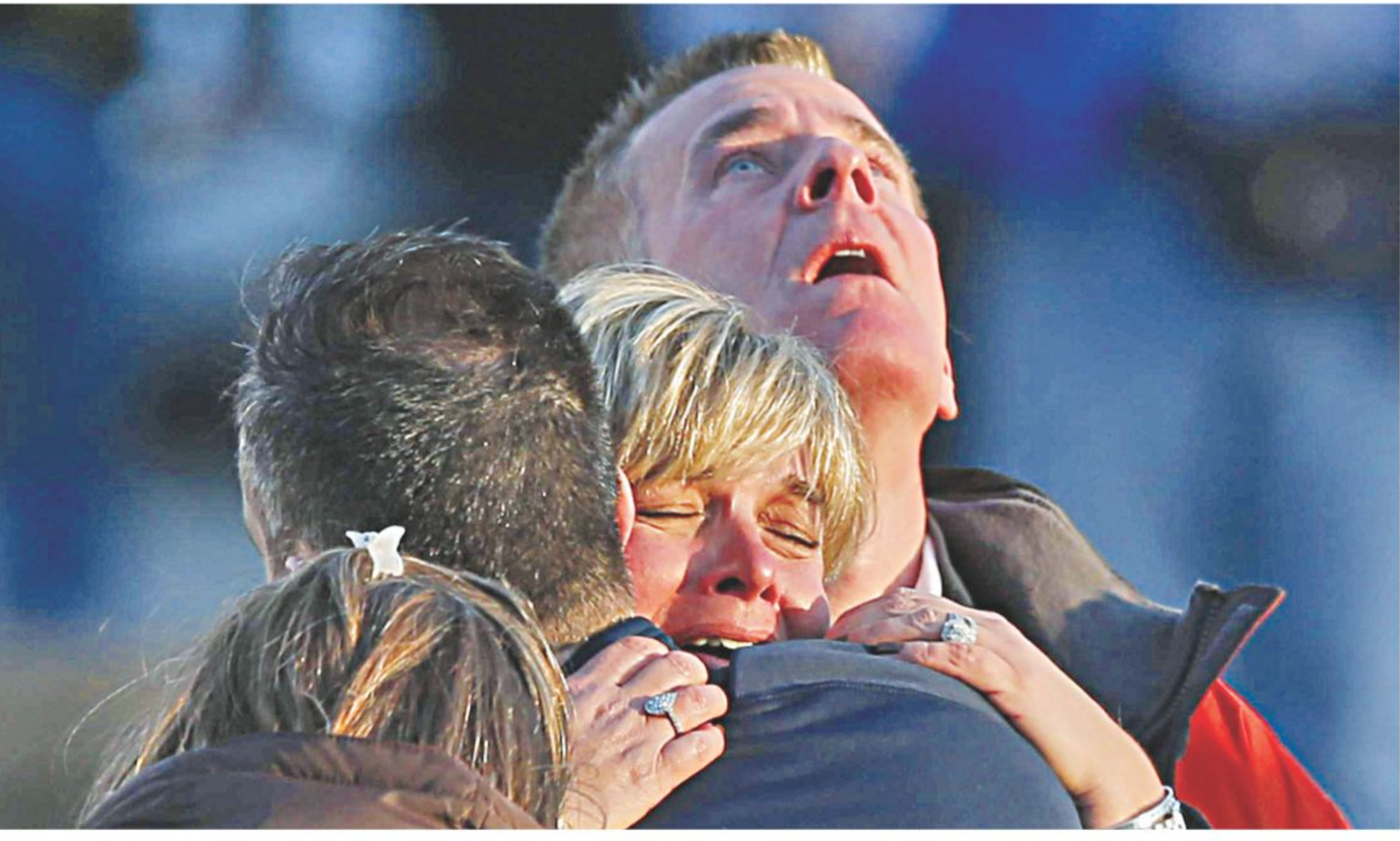
Grieving families gather near Sandy Hook Elementary School in Newtown, Connecticut, on Friday after a gunman opened fire on children and staff of the school, killing at least 26 people including 20 kids.