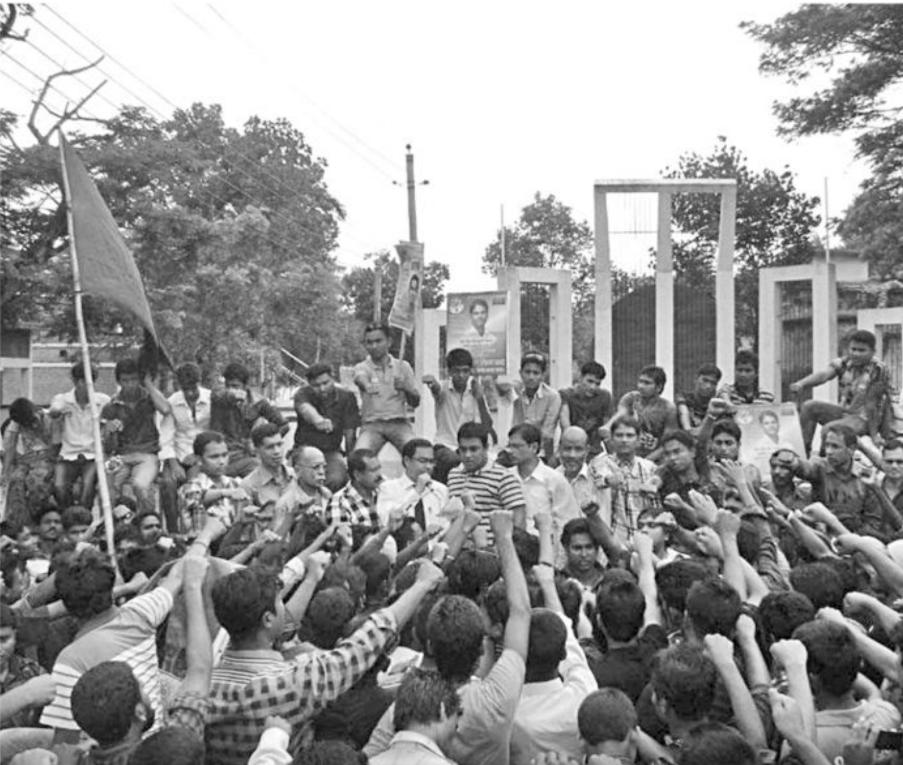
Office-bearers of the newly formed committee of JCD Pabna district unit take oath at the Central Shaheed Minar in the town yesterday. With the formation of the committee, an internal feud has surfaced in the unit as aggrieved JCD men have rejected the committee.

Later, the firefighters rescued the four but three of them died at hospital, OC said.