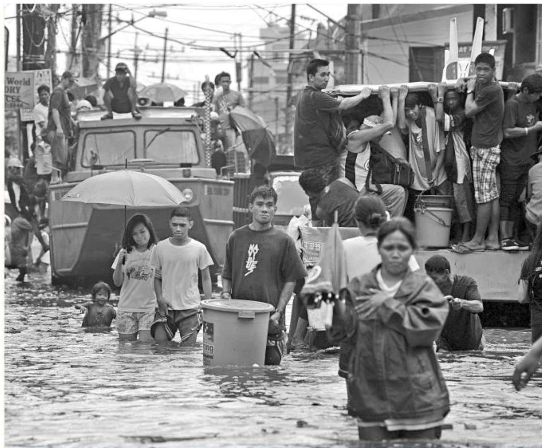
Residents wade through a flooded street in the town of Navotas in suburban Manila yesterday. Hundreds of people fled their homes after flooding from Typhoon Saola brought the death toll to 14 after four days of bad weather.

peace process, analysts said. However, a ban on investments in defence, space and atomic energy will remain and all propositions must come via the Indian government. The decision to accept foreign direct investment from Pakistan was taken in April when the trade ministers of the South Asian rivals met in New Delhi. They also discussed ways to ease visa curbs on business travel and the possibility of allowing banks from both countries to open cross-border branches. The improved relations between the rivals stem from Pakistan's decision to grant India "Most Favoured Nation (MFN)" status by year end, meaning Indian exports will be treated the same as those from other nations. MFN status will mean India can export 6,800 items to Pakistan, up from around 2,000 at present, and the countries aim to lift bilateral trade to $6 billion within three years, officials have said.