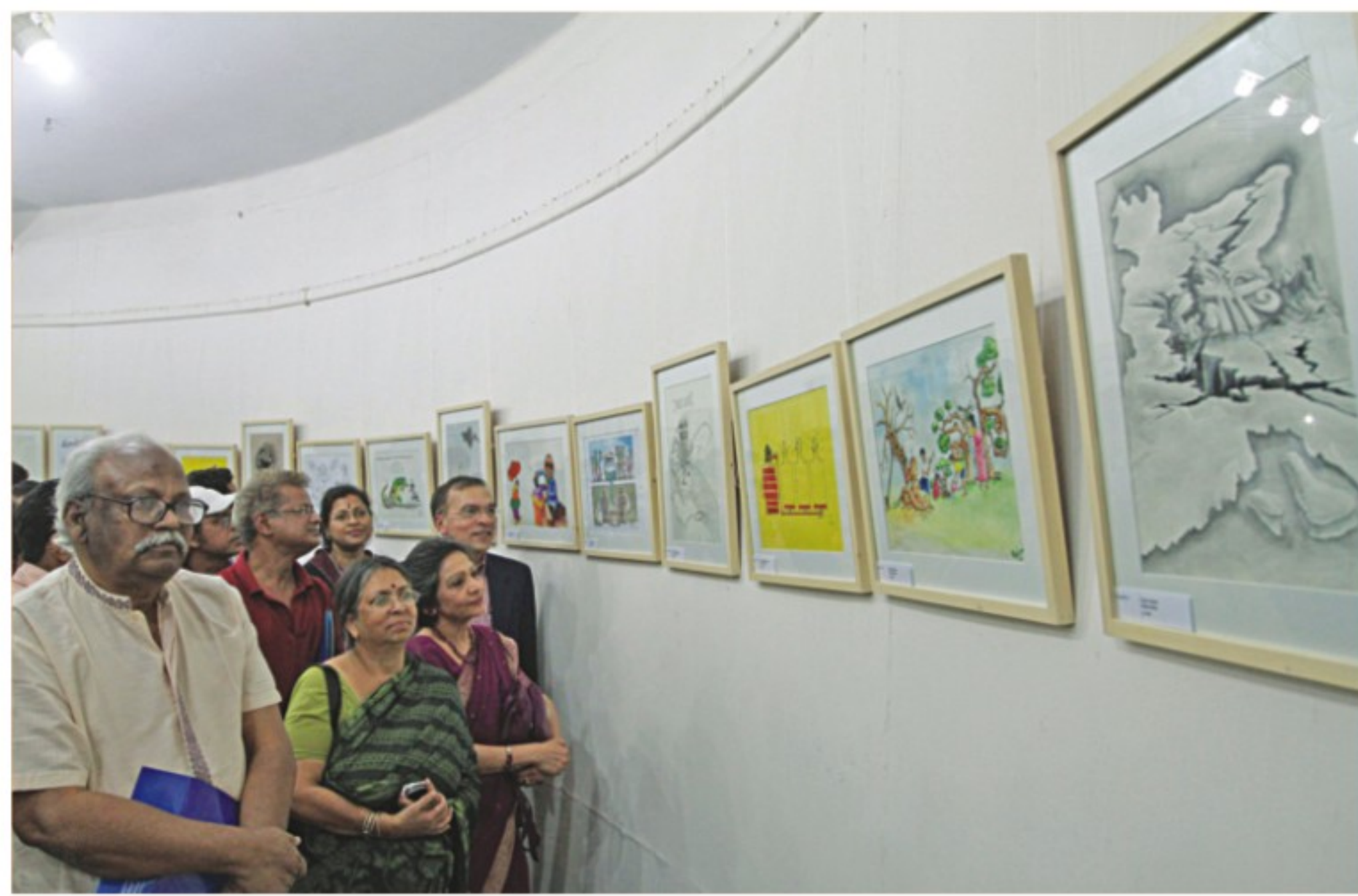
Visitors at a cartoon exhibition at the Faculty of Fine Arts of Dhaka University on the occasion of the International Anti-Corruption Day yesterday.

Corruption prevention committees formed by the commission observed programmes across the country yesterday while TIB began its fortnight programmes, marking the day.