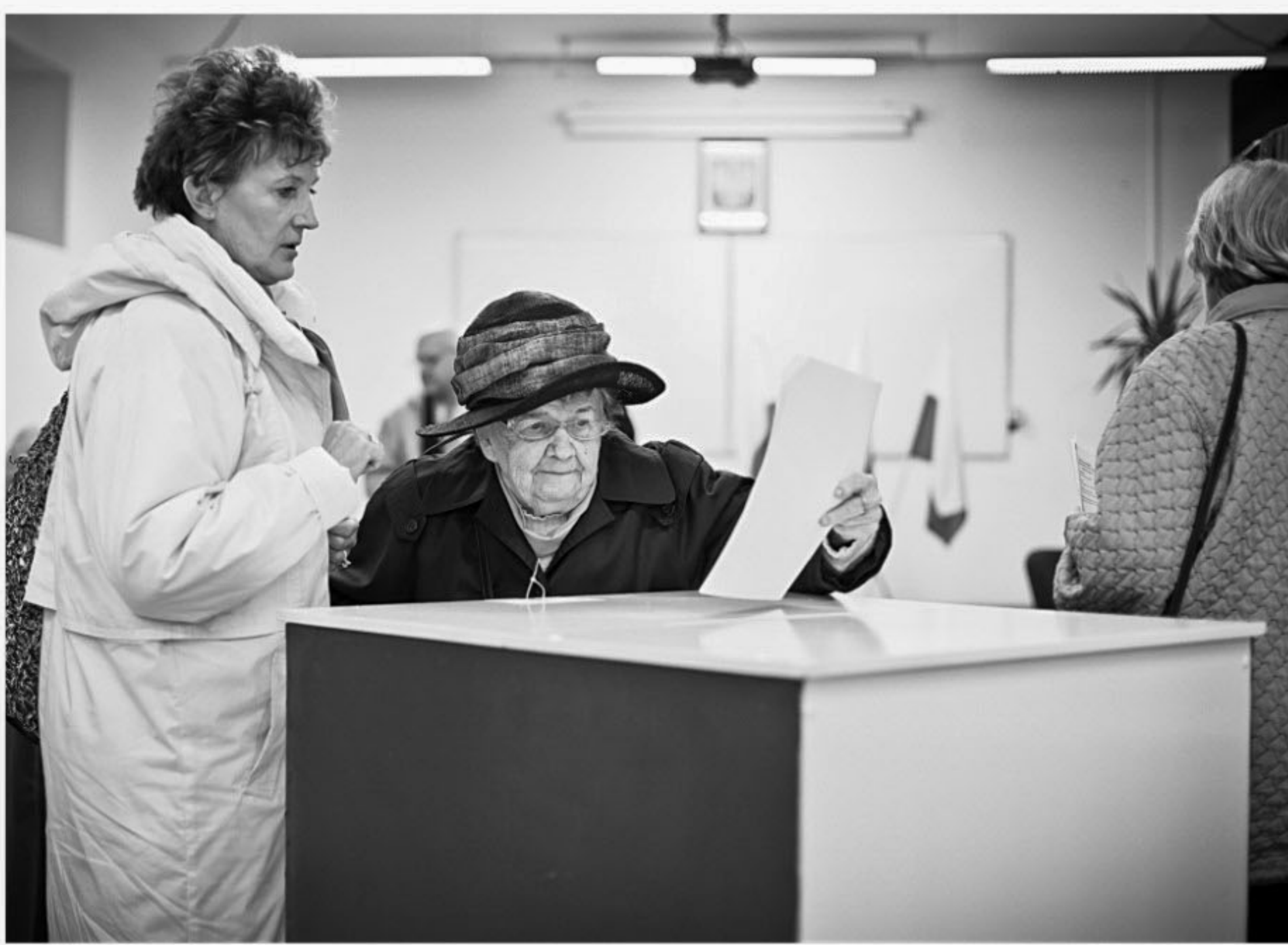
An elderly Polish woman casts her ballot in a polling station in Warsaw, during the parliamentary elections yesterday. Poles voted yesterday in a general election, with Prime Minister Donald Tusk targeting a landmark second term by pushing a message of prudent stewardship which kept the nation out of recession.