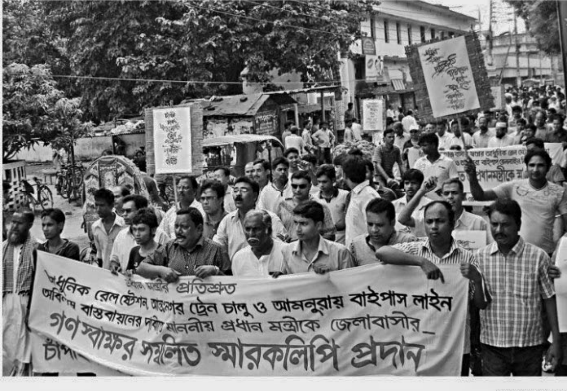
Several hundred people bring out a procession in Chapainawabganj town yesterday demanding intercity train service between Chapainawabganj and Dhaka, modernisation of the local railway station and construction of a railway bypass at Amnura Junction. Later, they submitted a memorandum containing signatures of 10,000 people to the prime minister through the deputy commissioner to press for the demands.