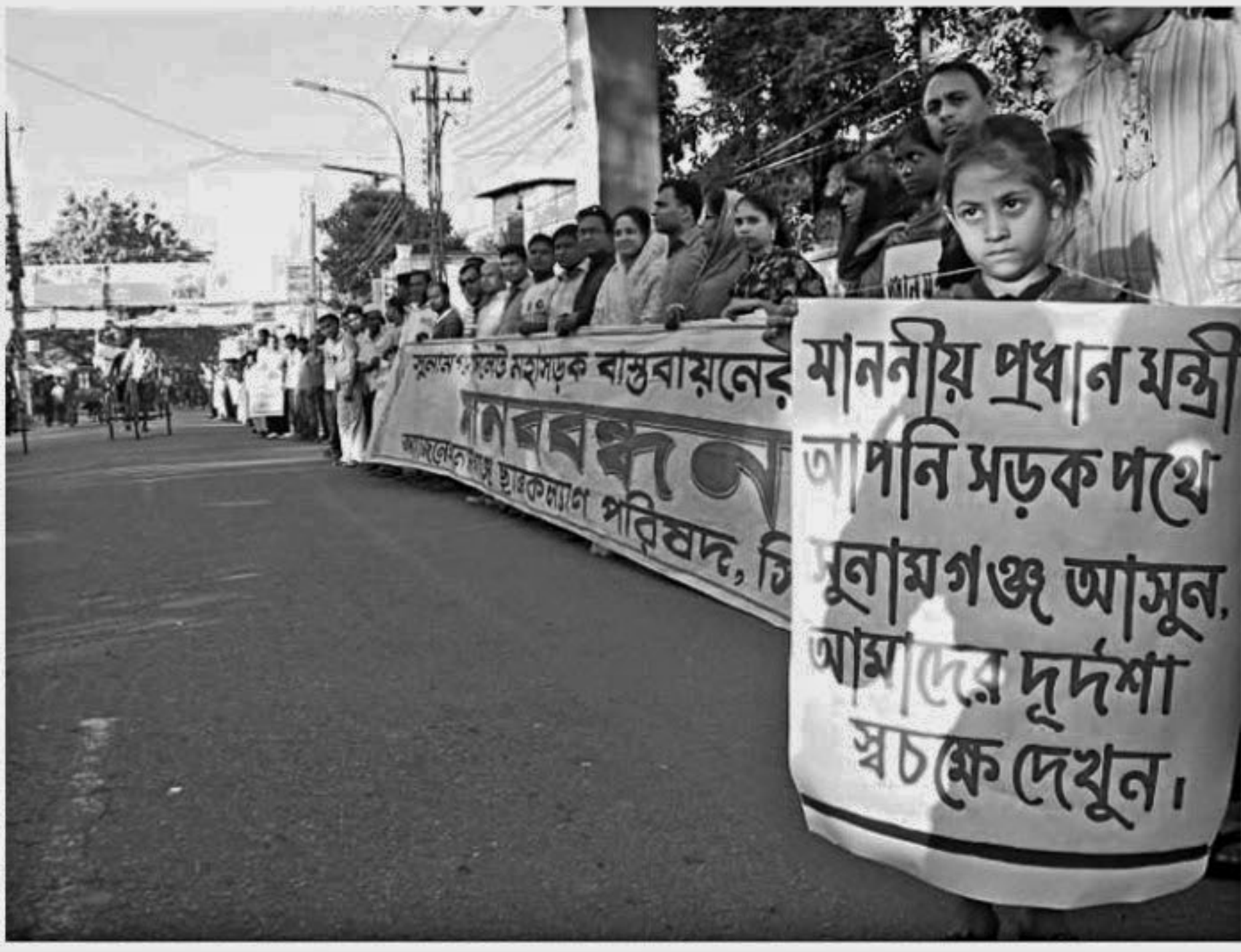
People of Sunamganj form a human chain in front of the Central Shaheed Minar in Sylhet city yesterday demanding implementation of Sylhet-Sunamganj highway project.