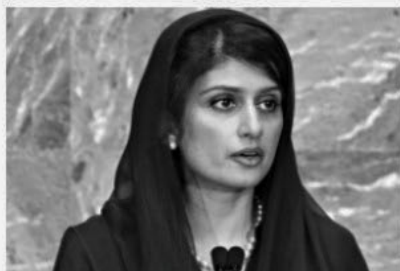
Hina Rabbani Khar

"Otherwise only the terrorists will gain." In a series of escalating rows, Washington has accused Pakistan's