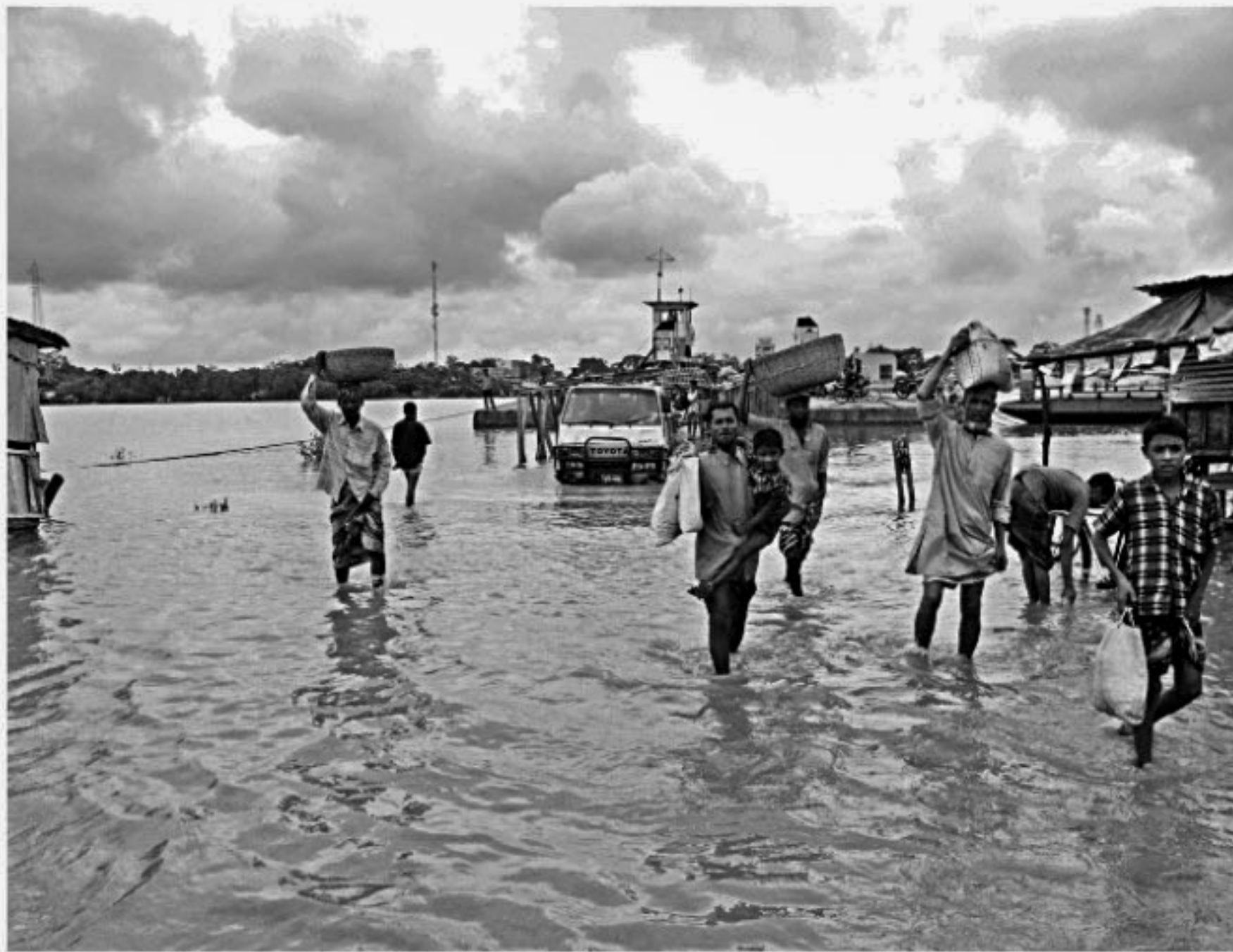
Suffering of commuters due to flooding of the gangway and approach roads of three ferry terminals on Kalapara-Kuakata road in Patuakhali district is a regular event during the high tide. The photo was taken from Kalapara ferryghat on Monday.