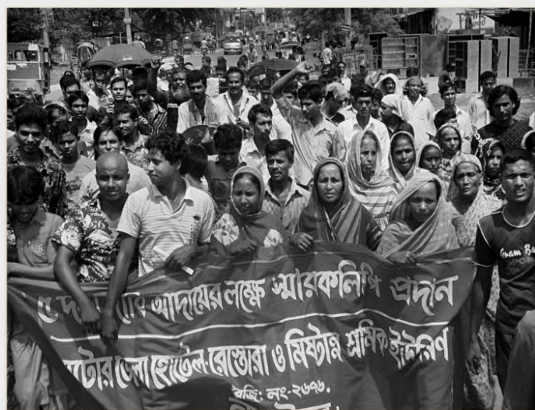
Workers of hotels and restaurants bring out a procession in Natore town yesterday demanding eight hours' daily work schedule, extra salary for overtime work, end to discrimination in salary and arrangement for weekly day off.

brought from Singapore. The total cost to rescue the ship may reach 15 lakh dollars, he added. Several persons involved in ship piloting and shipping business have demanded development of the navigation on the channel leading to the port to avert such accidents. About half of 18 signal lights are inactive, Harbour Master Lieutenant Commander Enamul Haque said, adding that the authorities called a tender to repair and modernise the inactive lights and the process will start very soon.