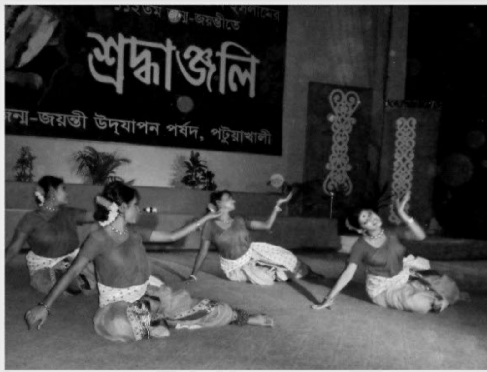
Artistes perform at a function at the Shipakala Academy auditorium in Patuakhali town, right, children take part in a kite festival at Jhitakpoddar Bari in Harirampur upazila of Manikganj district yesterday, marking 112th anniversary of birth of National Poet Kazi Nazrul Islam.