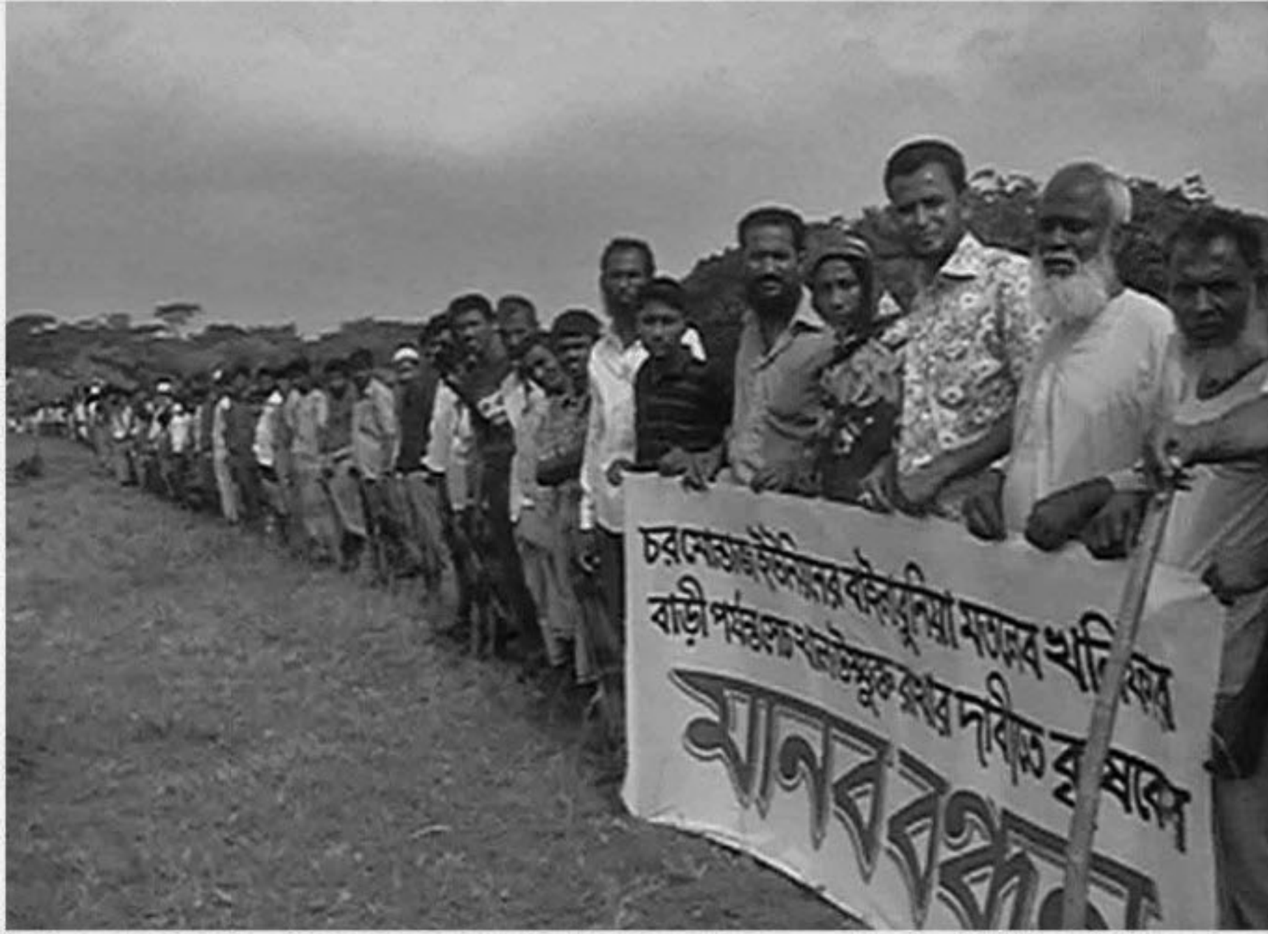
A large number of farmers form a human chain in Char Montaz union of Galachipa upazila under Patuakali district yesterday removal of dam on Bailabunia canal. Impediment to the flow of the canal hampers cultivation in the area, they said.

Acting Deputy Commissioner for Patuakhali Amol Krishna Mondol, when contacted, said, "Nobody can make any dam on canal and if anybody does it we will take lawful action."