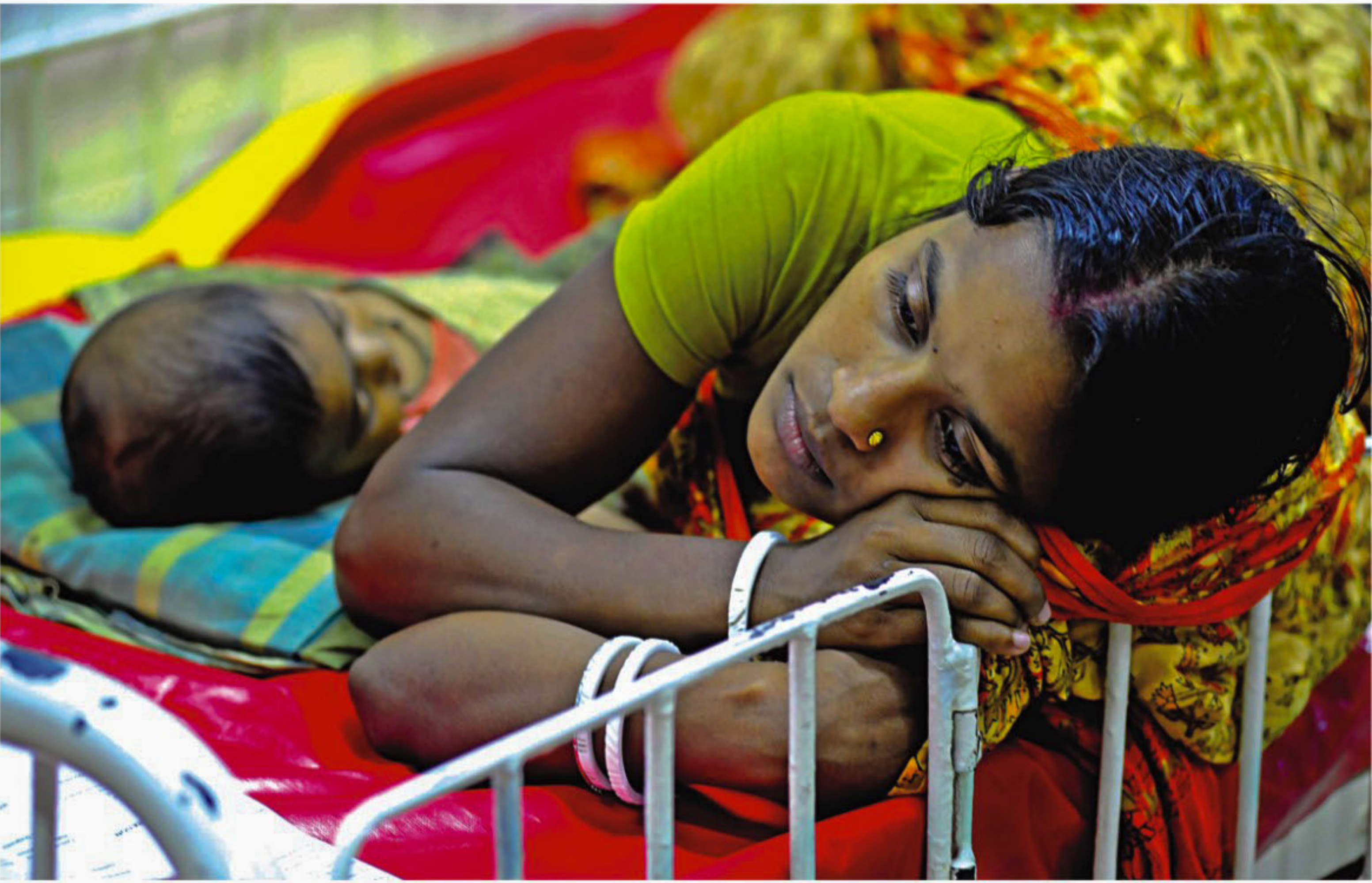
The infant in this photo has been suffering from diarrhoea for the last five days and is now admitted to ICDDR,B in the city. The five-month-old's mother, tired of nursing the baby round-the-clock, takes rest around 3:00pm yesterday. For the last few days, the centre saw a surge in the number of diarrhoea patients.