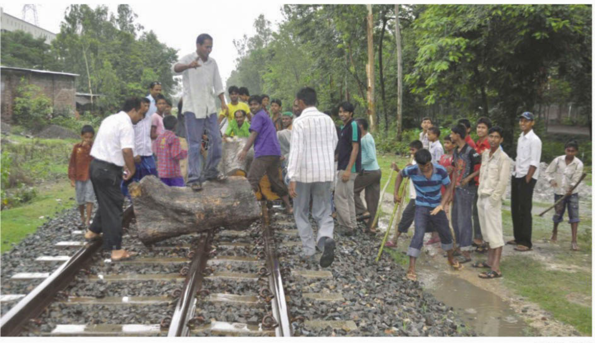
Locals put logs on the rail line near Barapukuria Bazar in Dinajpur district yesterday during the siege programme by National Committee to Protect Oil, Gas, Mineral Resources, Power and Port in protest against the government's plan for open pit mining in Barapukuria coal mine.