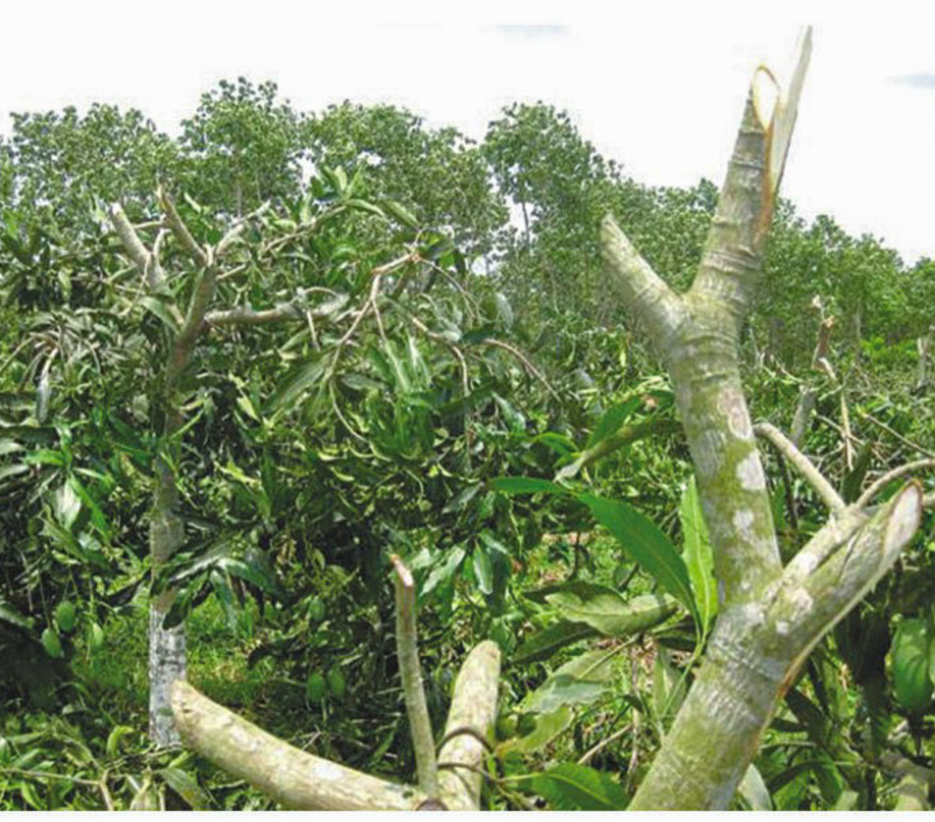
Criminals destroy a good number of trees of Cosmic Agro Farm at Toichakmapara in Ramgarh upazila under Khagrachhari district on Monday night. Another farm in a nearby area also fell victim to the same group's savagery on the night.

The protesters withdrew the blockade at about 1:00pm after officials of the local administration told them that no university students was killed or injured in the accident.