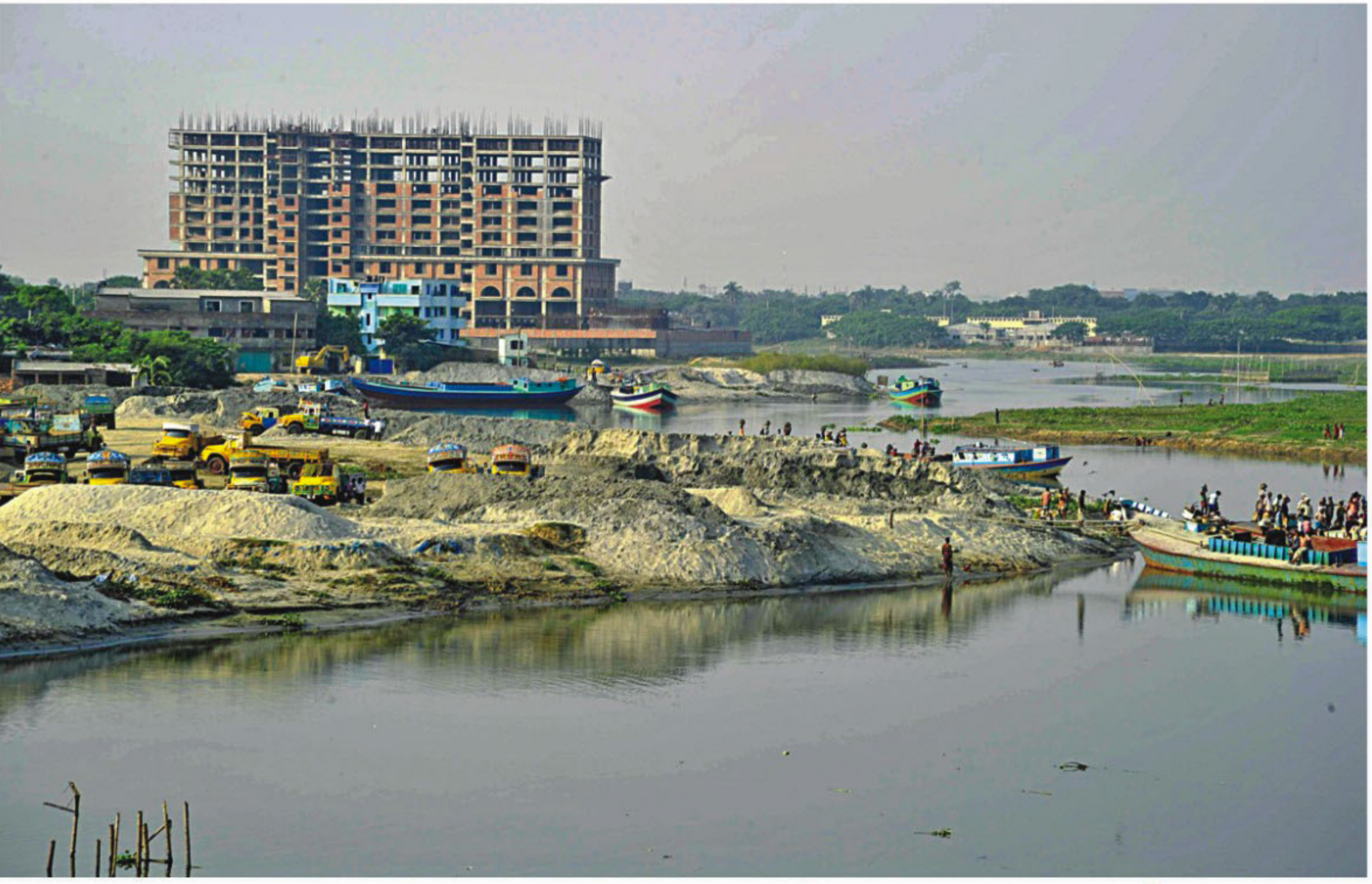
Influential people continue to encroach on the Turag river in the name of sand trade. The photo taken near the Ijtema camp on the Turag's bank shows nearly two-thirds of the river have been filled up.