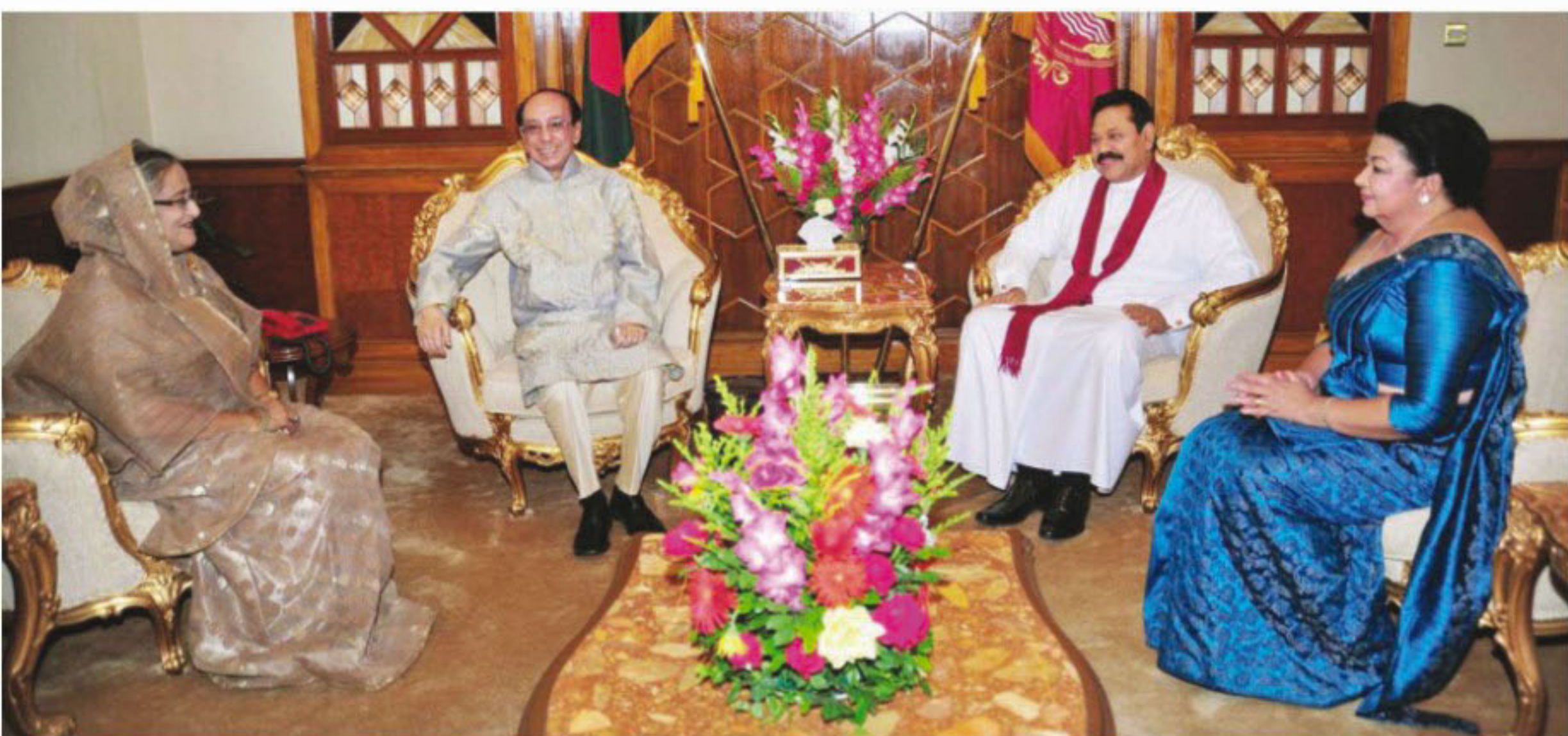
President Zillur Rahman, Prime Minister Sheikh Hasina and visiting Sri Lankan President Mahinda Rajapaksa and first lady Shiranthi Rajapaksa hold meeting at Bangabhaban in the city last night.