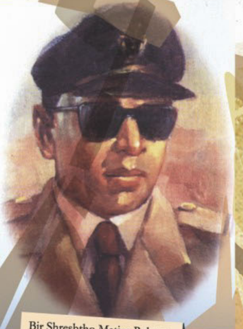
Bir Shreshtho Matiur Rahman বীরশ্রেষ্ঠ মতিউর রহমান