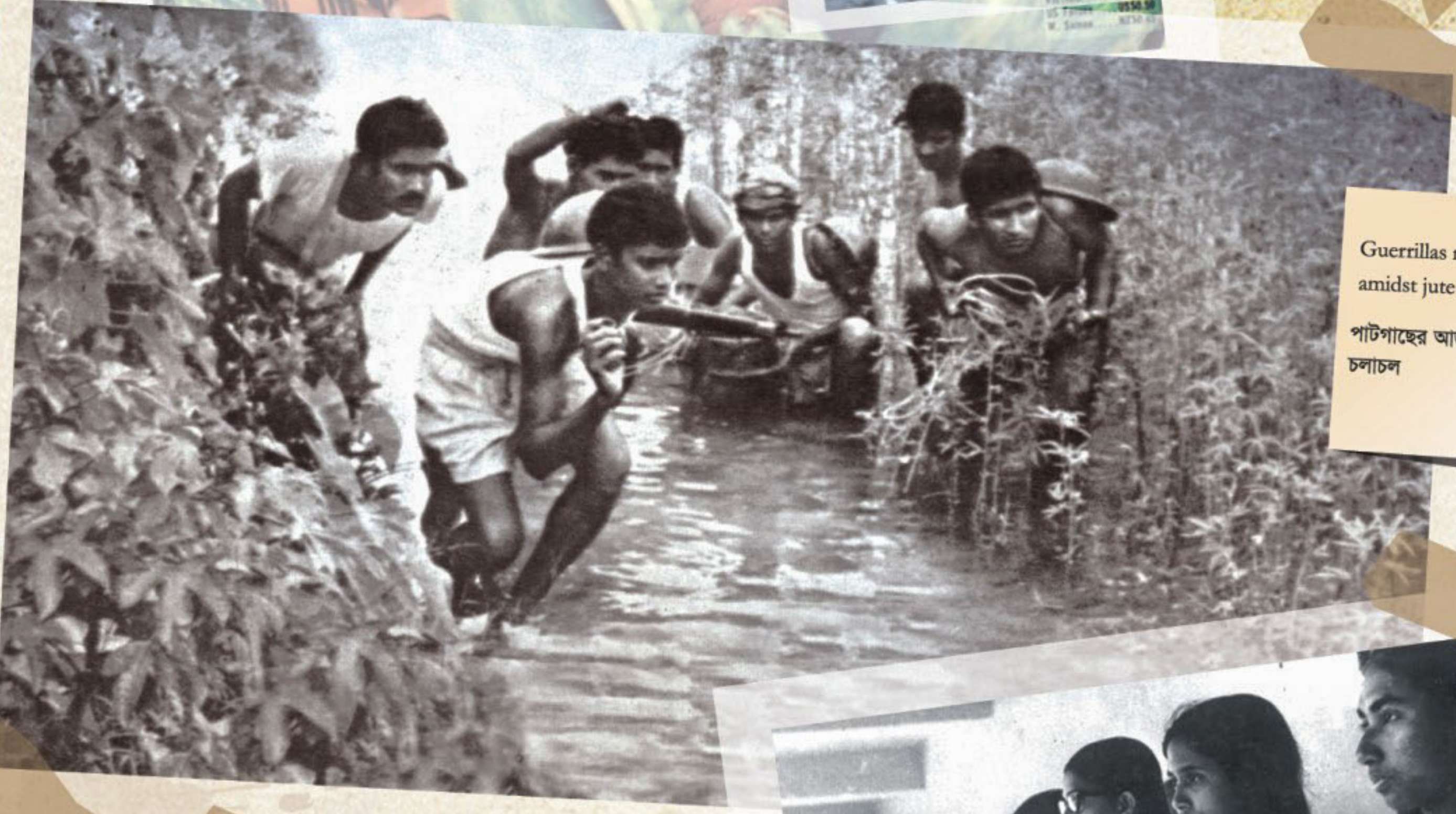
Guerrillas moving secretly amidst jute plants পাটপাছের আড়ালে গেরিলাদের চলাচল