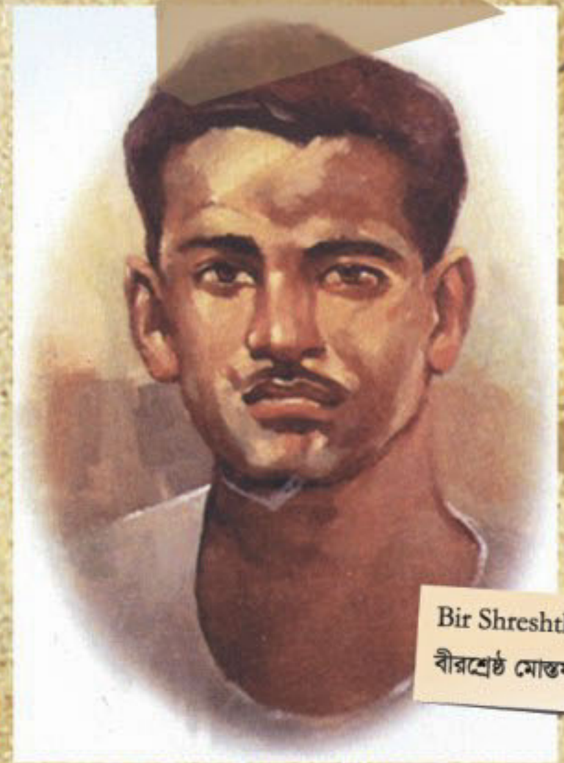
Bir Shreshtho Mostafa Kamal বীরশ্রেষ্ঠ মোস্তফা কামাল