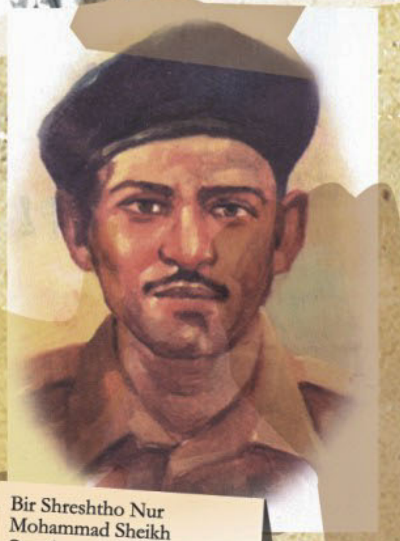
Bir Shreshtho Nur Mohammad Sheikh বীরশ্রেষ্ঠ নূর মোহাম্মদ শেখ