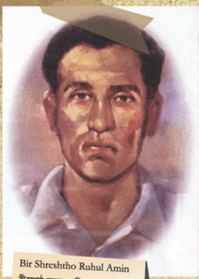
Bir Shreshtho Ruhul Amin বীরশ্রেষ্ঠ রুহুল আমিন