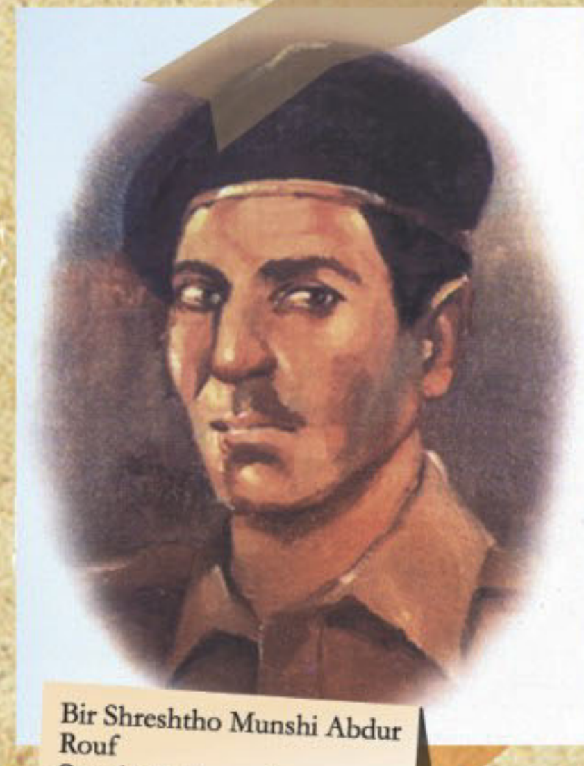
Bir Shreshtho Munshi Abdur Rouf বীরশ্রেষ্ঠ মুন্সি আবদুর রউফ