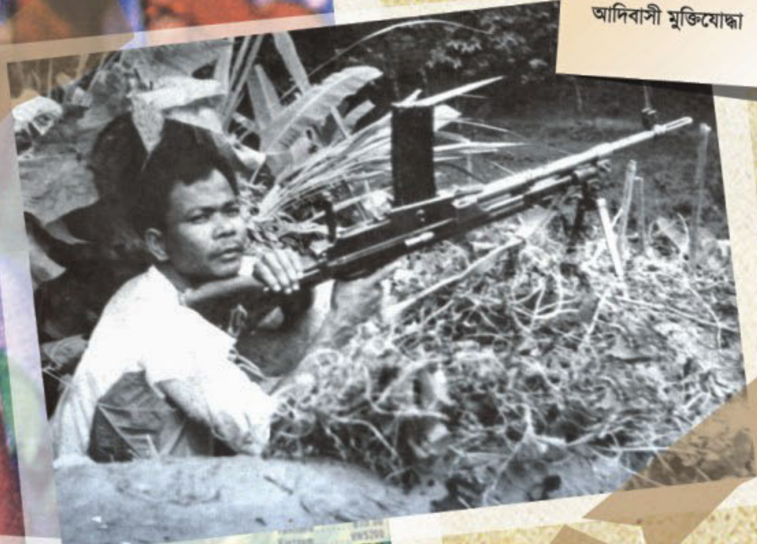
An aboriginal freedom fighter আদিবাসী মুক্তিযোদ্ধা