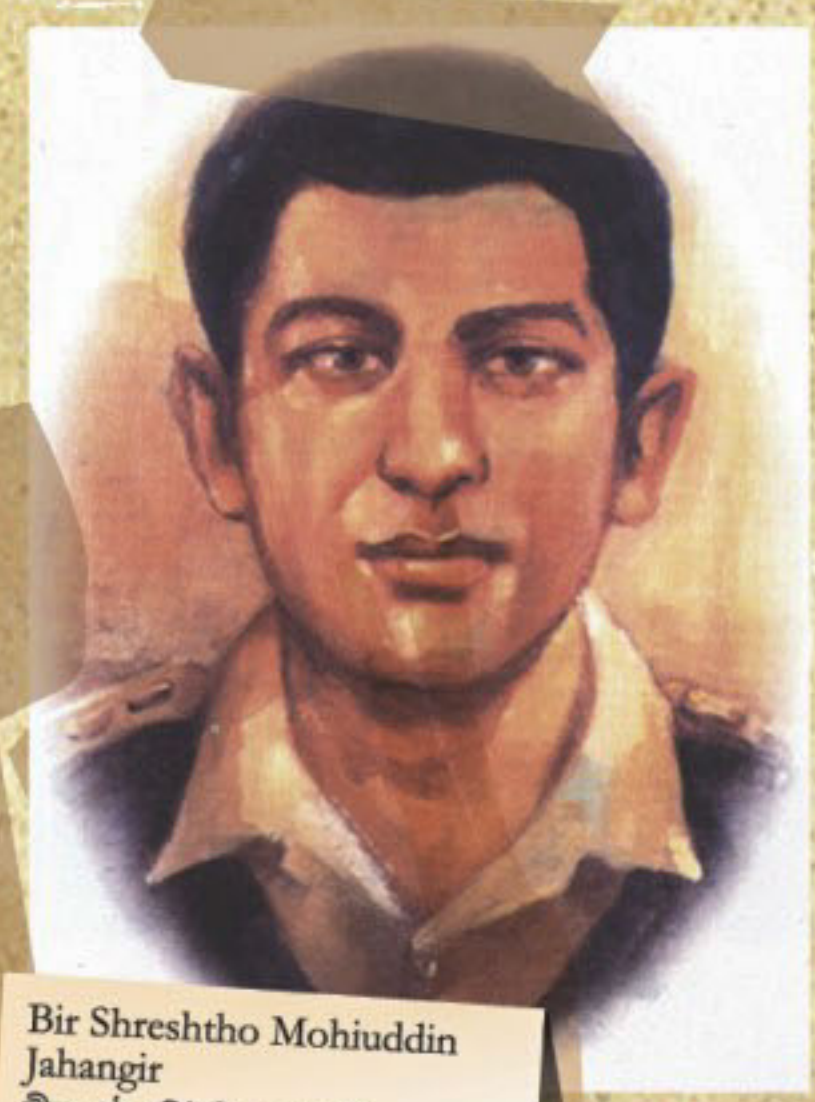
Bir Shreshtho Mohiuddin Jahangir বীরশ্রেষ্ঠ মহিউদ্দিন জাহাঙ্গীর