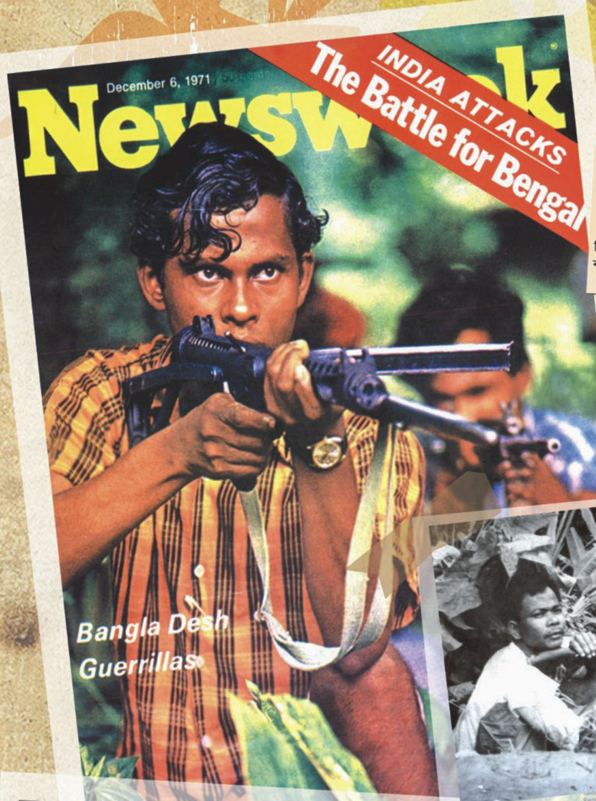
Photo of a Bangladeshi guerrilla on the cover of Newsworld নিউজউইক পত্রিকার প্রচ্ছদে বাংলাদেশি গেরিলাস ছবি

The glorious history of Bangladesh 1 2 3 4 5 6 7 8 9 10