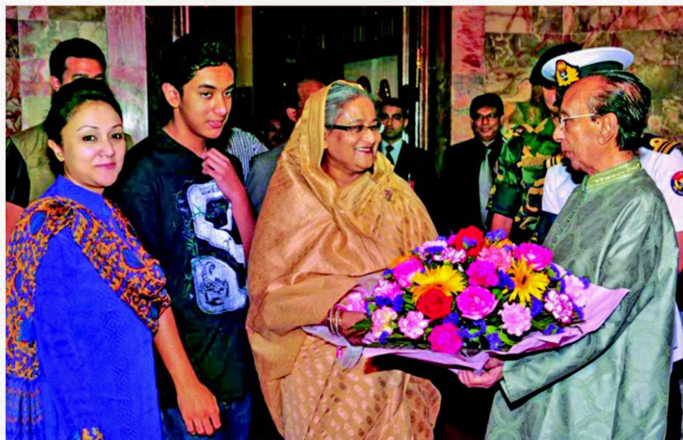
Prime Minister Sheikh Hasina greets President Zillur Rahman with a bouquet at Bangabhaban in the city on his 82nd birthday yesterday.

"Indian government has assured us of using rubber bullets," she added.