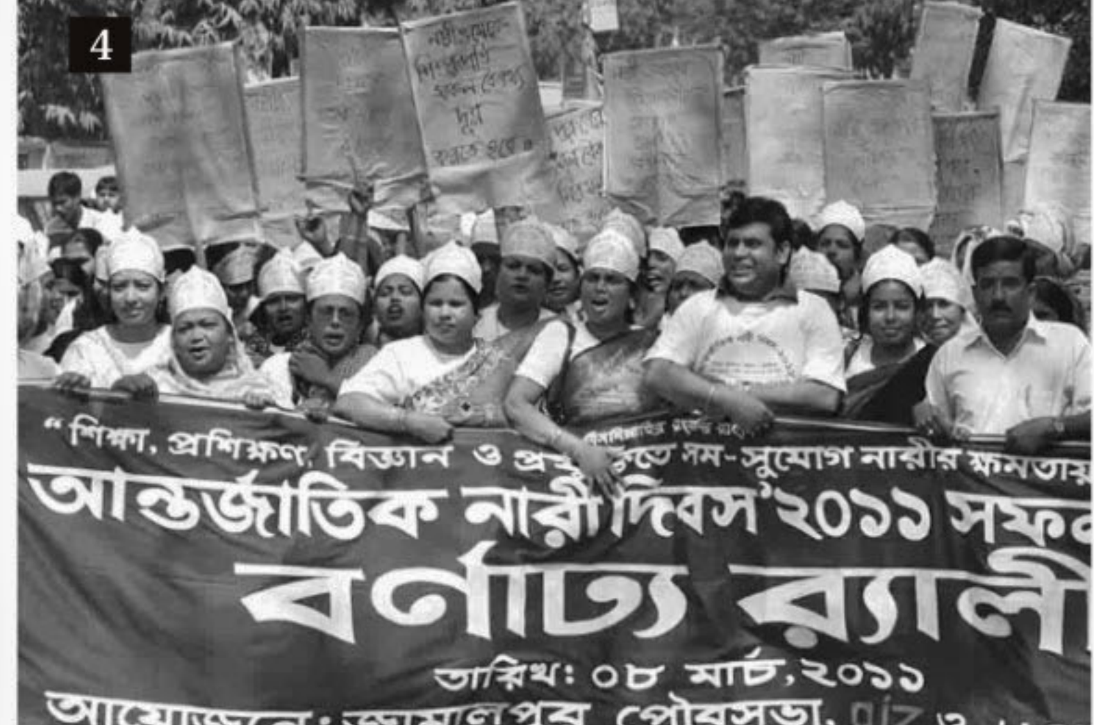
1) Paribaric Nirjaton Protirodh Jote observes a candlelit vigil styled 'Andhar Bhangar Shapoth' (oath to break the darkness) in Dinajpur, 2) Sushashoner Jonno Procharabhijan and Swaroni Manob Unnayan Sangstha form a human chain at Nirala intersection in Tangail town, 3) Paribaric Nirjaton Protirodh Jote organises a cultural function at Aswini Kumar Hall in Barisal city, 4) Jamalpur municipality, giz, and UGIIP-II jointly bring out a colourful procession in the town marking 101st International Women's Day yesterday.