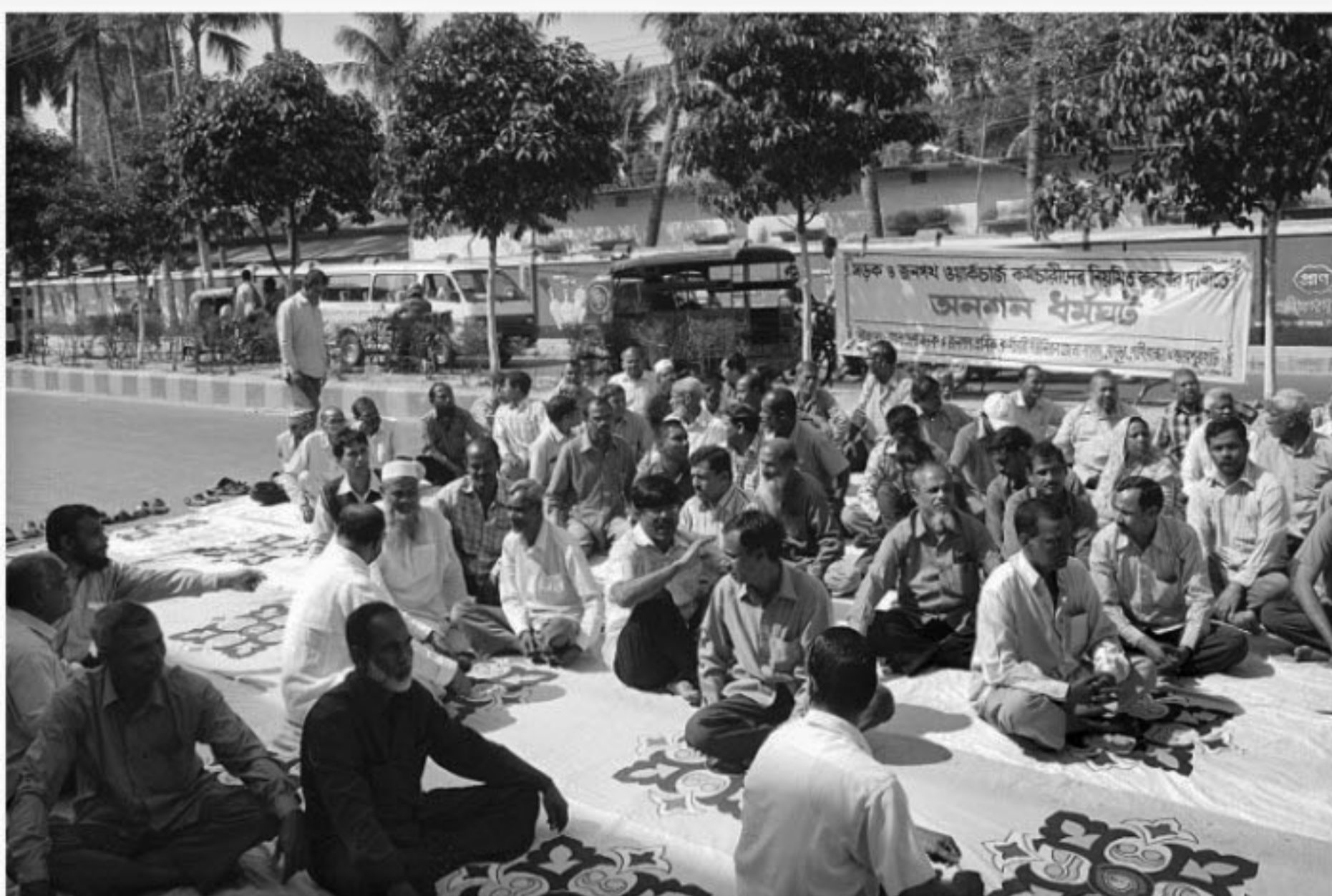
Roads and Highways Department employees observe a mass hunger strike yesterday blocking the road in front of their office in Bogra.