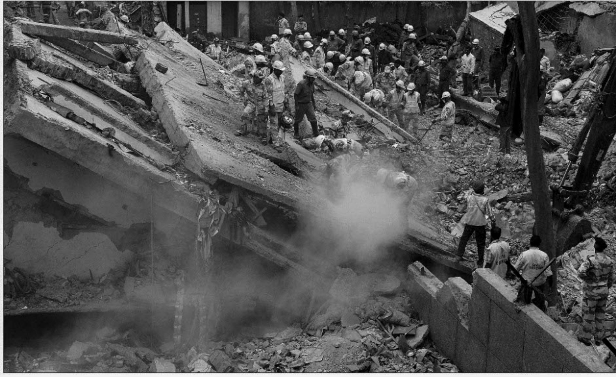
Indian rescue personnel clear the rubble of a building which collapsed overnight in eastern New Delhi on Tuesday. At least 69 people were killed when the building that housed scores of migrant families collapsed in New Delhi, as rescuers made slow progress through the rubble.