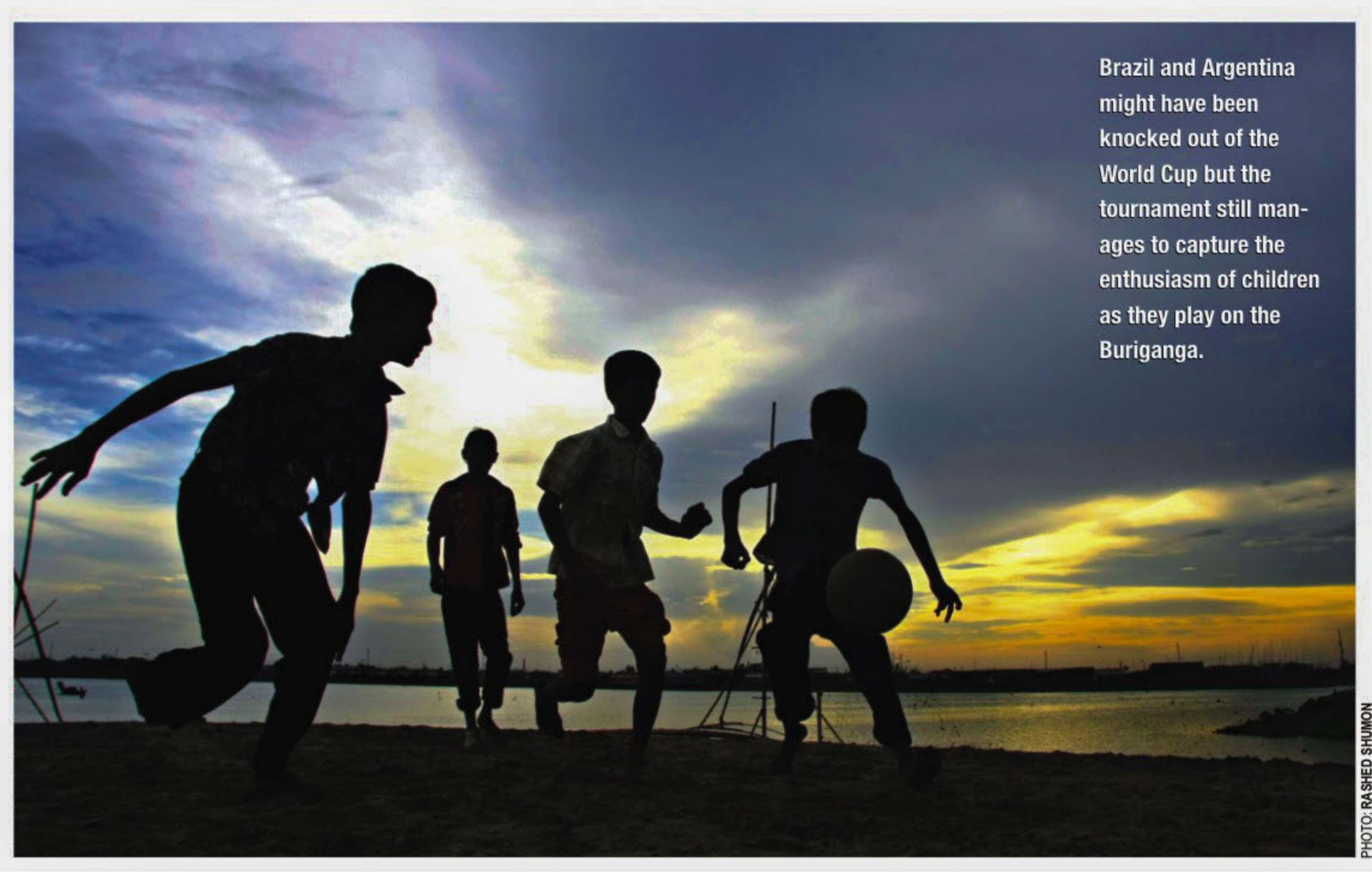
Brazil and Argentina might have been knocked out of the World Cup but the tournament still manages to capture the enthusiasm of children as they play on the Buriganga.