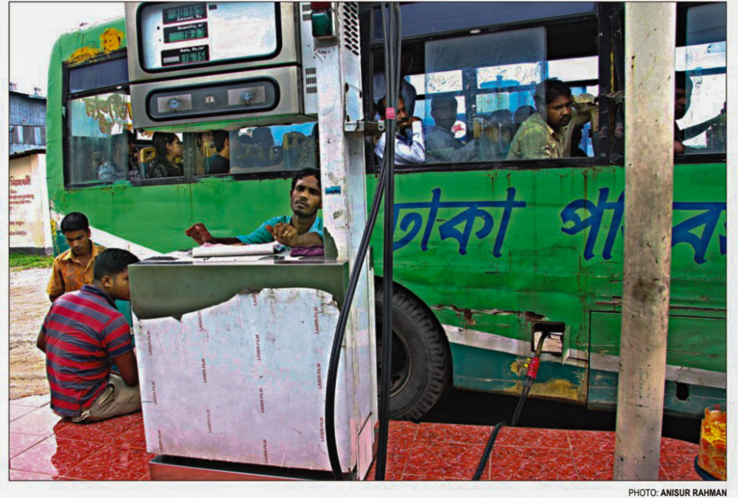
A bus loaded with passengers is being refueled at a CNG filling station in Mohakhali in the capital ignoring safety rules.

informed the home ministry about their unauthorized activities, sources said. Kamal Uddin Ahmed, joint secretary (political) of the ministry, told The Daily Star last week that there are allegations against some local NGOs and international NGOs that they are involved in subversive activities. A few NGOs even published features on their websites damaging the country's reputation, he added. He also said that if the ministry does not find any instances of wrongdoing, it will let the NGOs continue their activities.