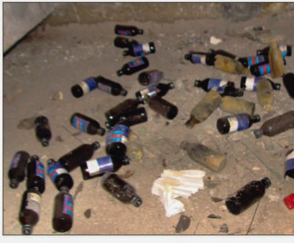
A makeshift stall selling addictives and empty bottles of phensidyl left by users at a field on Rajshahi University campus bear testimony to drug abuse there, especially during vacations.