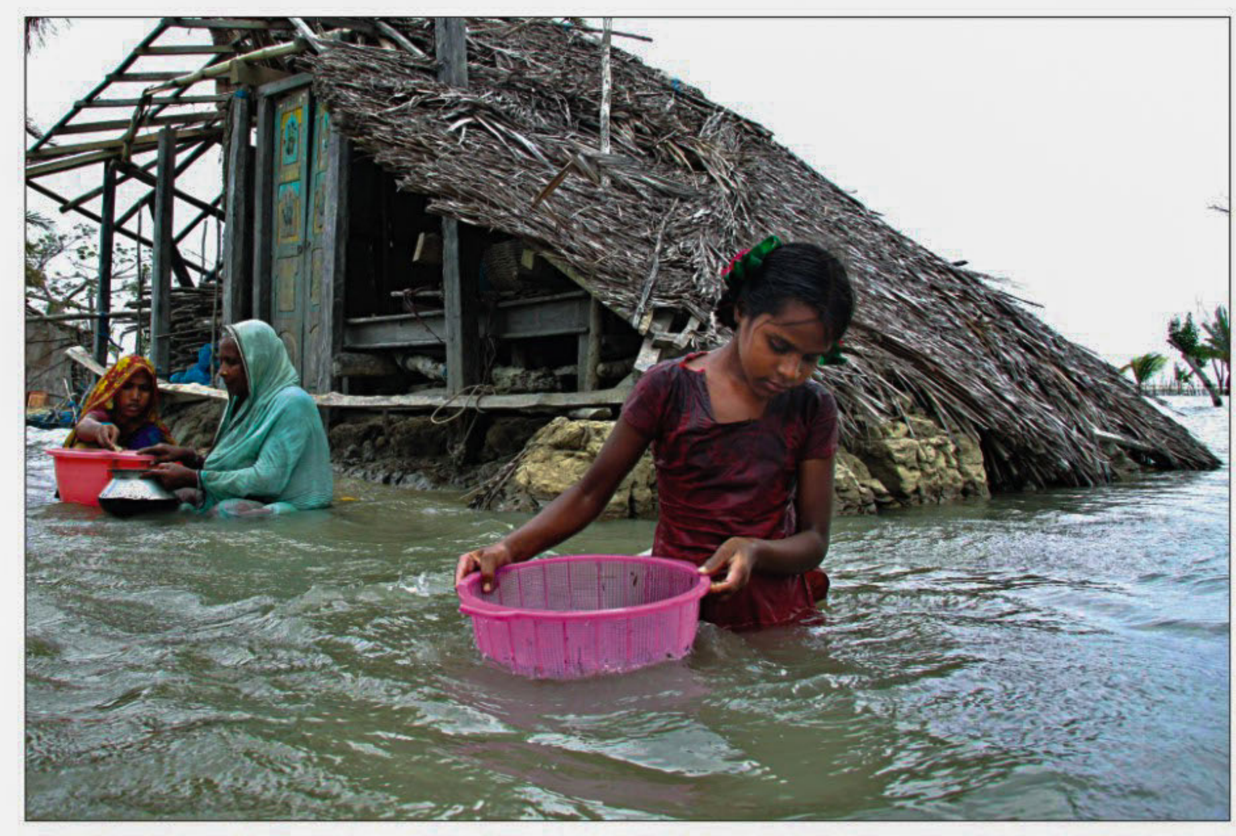
At school-going age, a girl is catching fish for a living at Aila-hit Gabura union in Satkhira. Since the cyclone struck the area in May last year, most of the locals have remained unemployed.