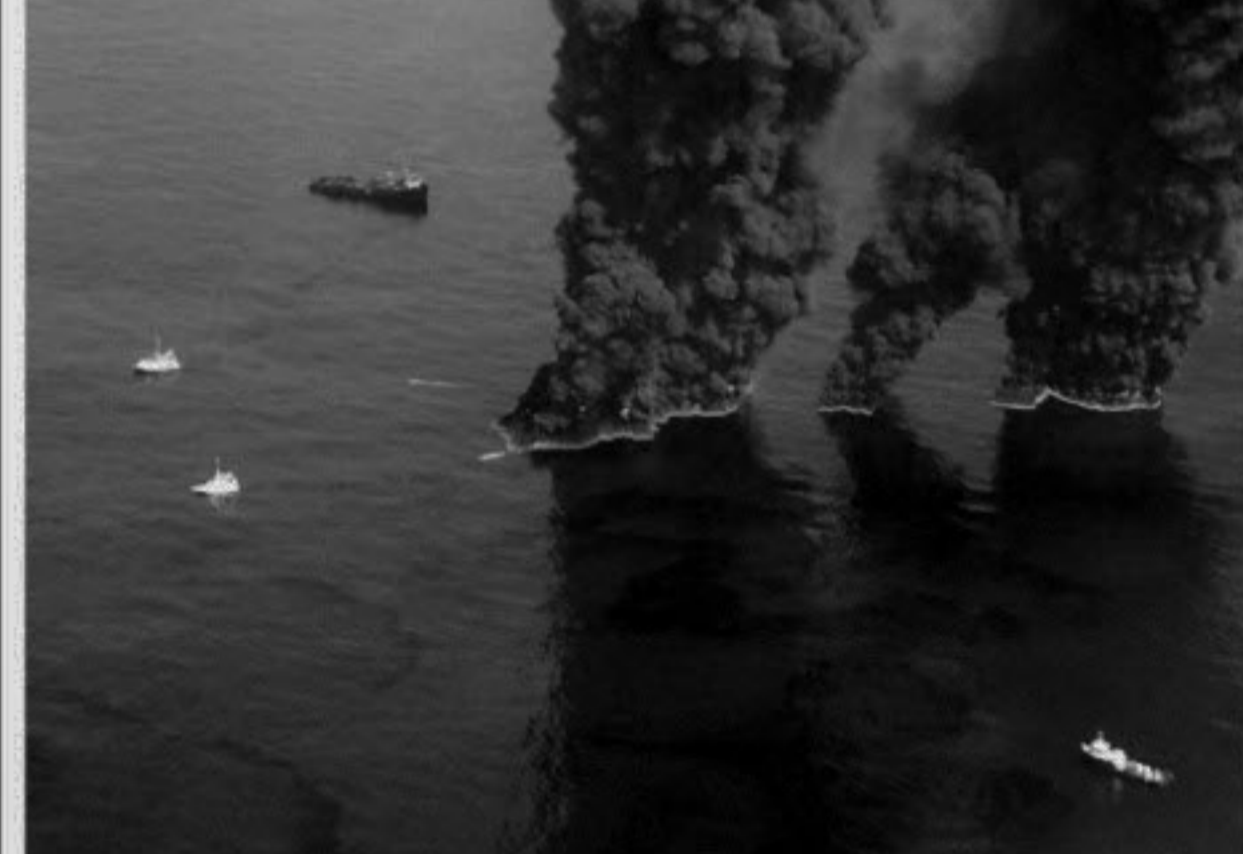
This US Coast Guard handout image shows crews conducting over flights of controlled burns taking place in the Gulf of Mexico yesterday in the Gulf of Mexico. During controlled burns, oil from the Deepwater Horizon incident is burned in an effort to reduce the amount of oil in the water.

BP shares rose nearly 3 percent on Thursday in early London trading.