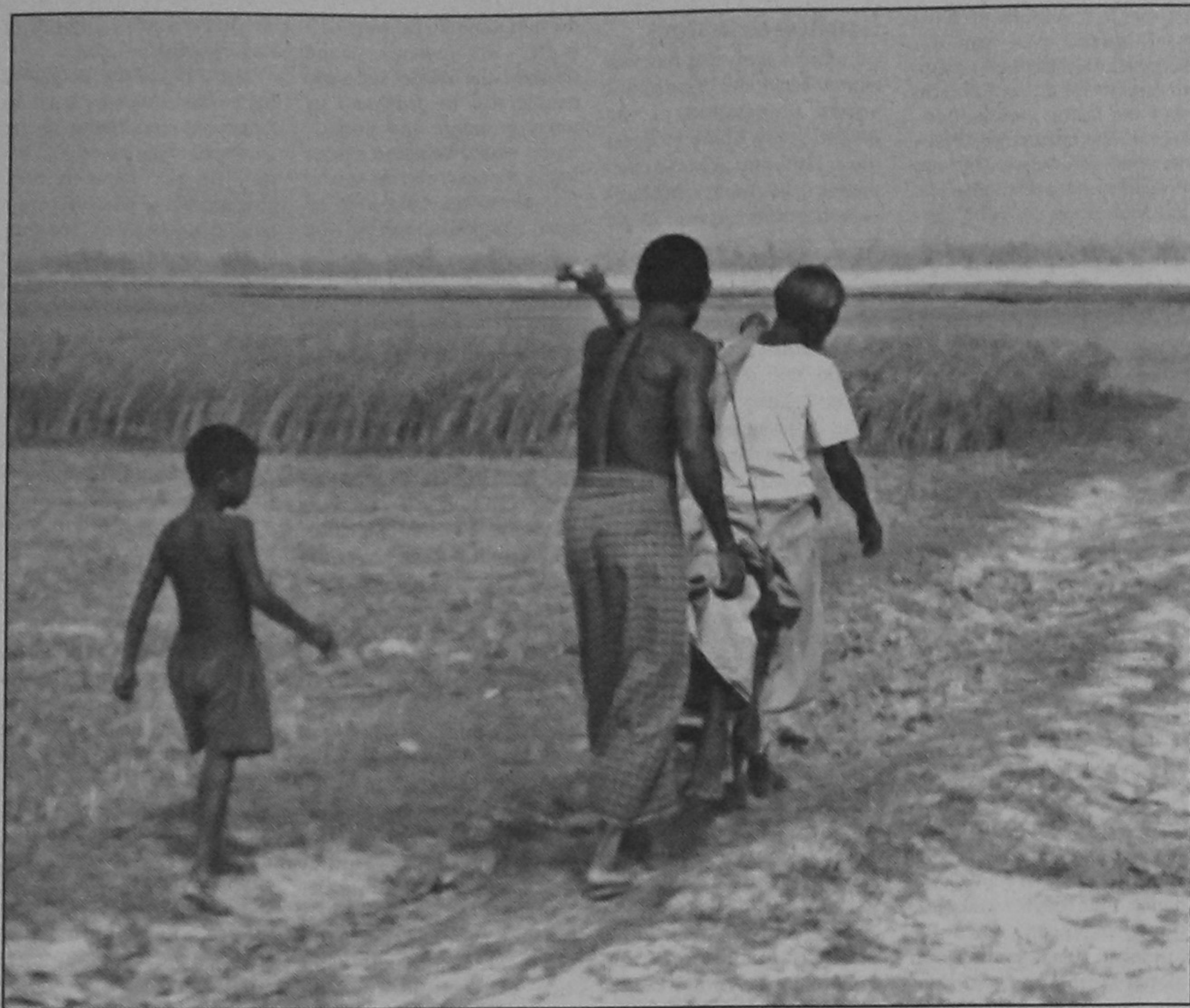
Carried by relatives, a patient from Char Gobardhan under Mohishkhocha union in Aditmari upazila of Lalmonirhat district heading towards a health centre, about 10-kilometre away from the remote island in the Teesta River.