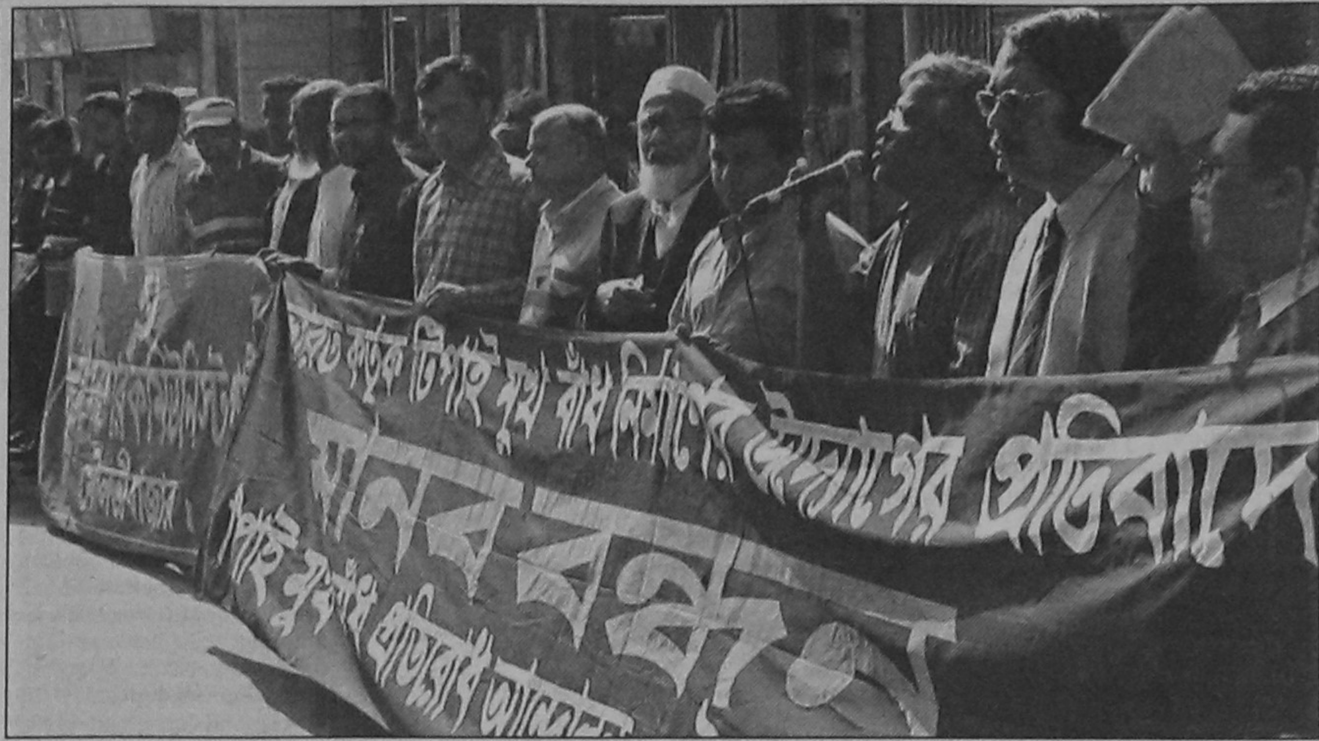
National Awami Party, Communist Party of Bangladesh, Gonojantr Party and Bangladesher Samajtantrik Dal form a half kilometre-long human chain at Chaumohana Square in Moulvibazar town on Saturday protesting Indian move to construct Tipaimukh dam.