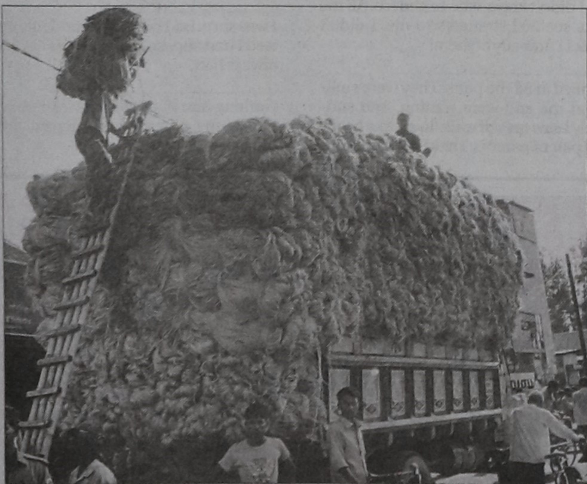
Jute is being loaded onto a truck for transporting to a mill as Dhunat upazila in Bogra district this year sees good yield of the once dominating cash crop.

After a company commander-level flag meeting of BDR and BSE, the Indian citizen was later handed over to Indian border guards.