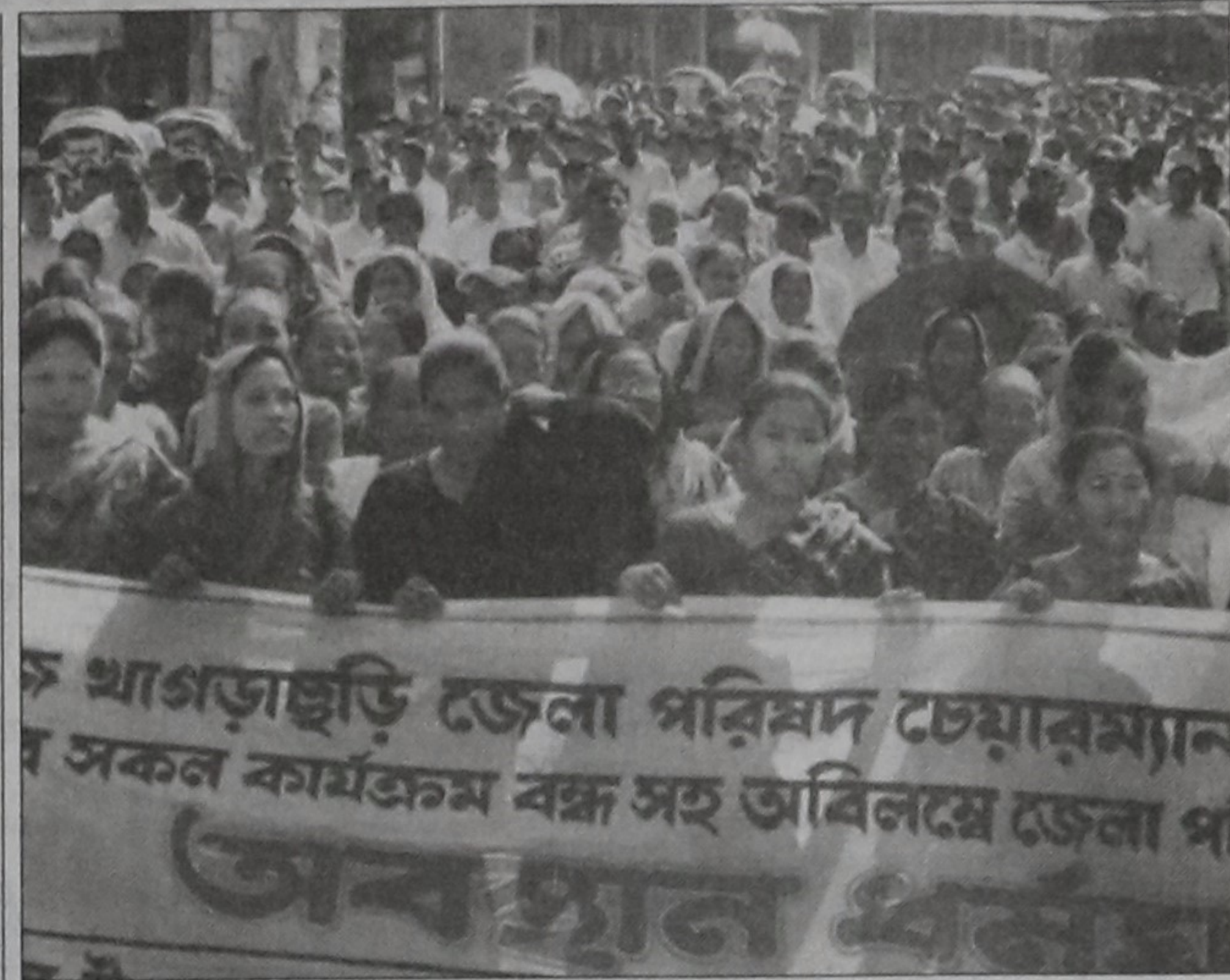
Leaders and activists of ruling Awami League demonstrate in front of the office of Khagrachhari Hill District Council (KHDC) yesterday to press home their six-point demand including removal of KHDC chairman and three councillors.

Victims claimed the cash and other valuables, worth about Tk 20 lakh were gutted in the blaze.