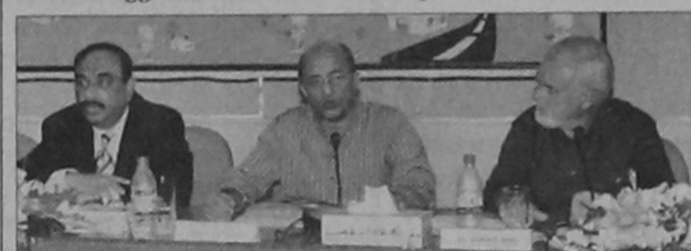
Dr Tawfik-e-Elahi Chowdhury, Prime Minister's energy adviser, speaks at a workshop on energy saving in Dhaka yesterday.