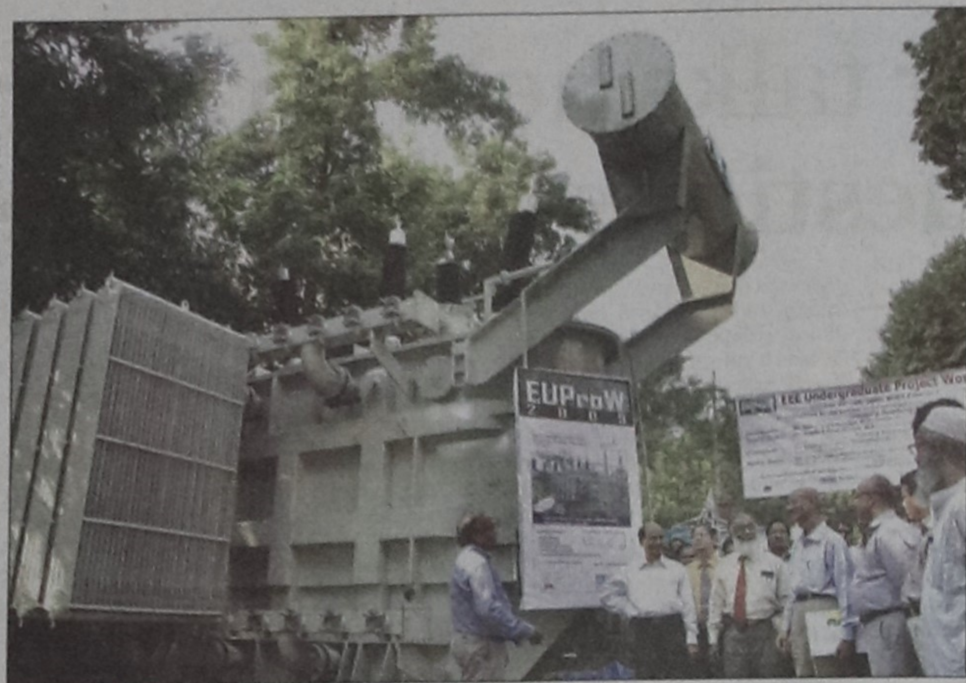
Education Minister Nurul Islam Nahid visits a project of the undergraduate students of Electrical and Electronic Engineering department on the BUET campus yesterday after inaugurating EUProw-2009 at its auditorium.

"We went to the dean of faculty to know reason of increasing the fee. But, we became surprised that he [dean] does not know the matter and assured us to see the matter," a student of journalism department said.