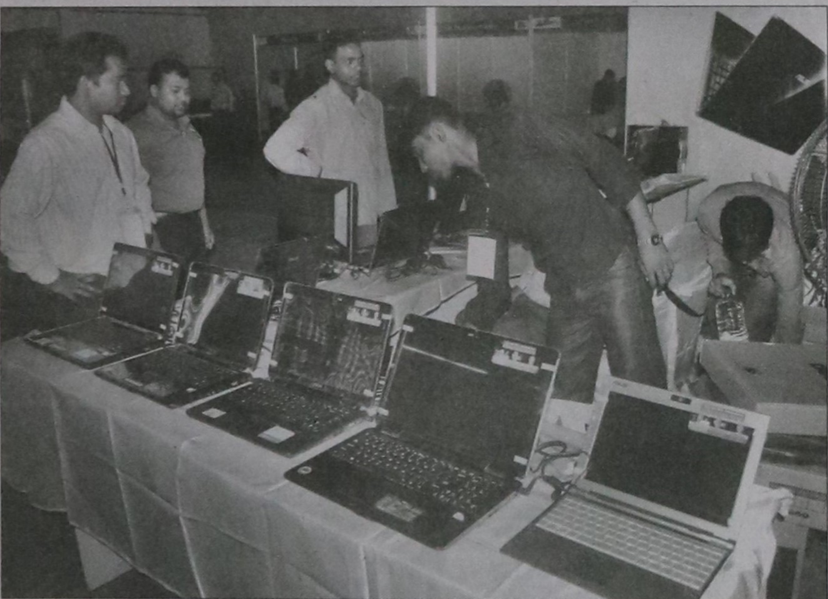
Laptops are on display at a stall in the three-day IT fair in Bogra town yesterday.

Fu-Wang Food was the largest gainer that rose by 26.94 percent on the CSE, while Dhaka Fisheries was the biggest loser that declined by 11.26 percent.