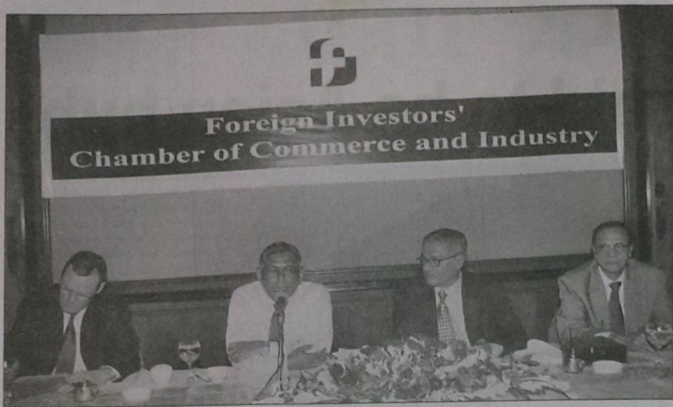
State Minister for Power, Energy and Mineral Resources Enamul Haque speaks at a monthly luncheon meeting of Foreign Investors' Chamber of Commerce and Industry (Ficci) in Dhaka yesterday. Ficci President Waliur Rahman Bhuiyan is also seen.