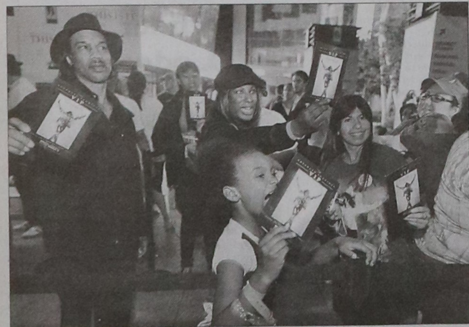
Michael Jackson fans show off their VIP passes and celebrate the end of their three-day wait as tickets finally go on sale at 12:01 am on Sunday for a special pre-screening of the Michael Jackson film "This Is It," at LA Live in Los Angeles.

Since then the European Union and Nato have worked hard to smooth over ties with Russia and no one wants to rock the boat. Moscow's help is needed to curb Iran's nuclear ambitions and fight insurgents in Afghanistan.