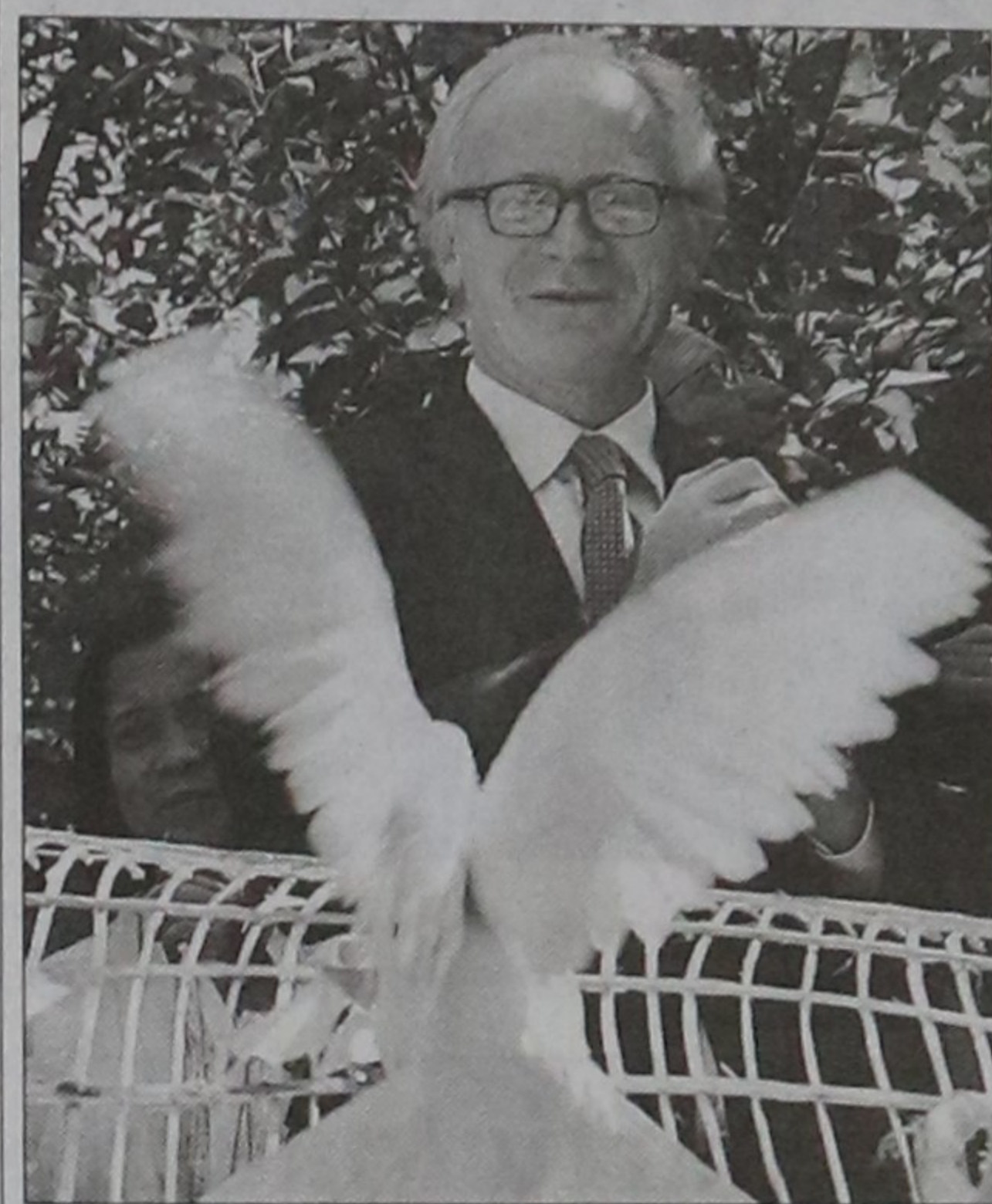
United Nations special envoy to Afghanistan Kai Eide releases doves after a press conference at the UNAMA office in Kabul yesterday ahead of UN Peace Day on September 21. Fallout from suspected ballot stuffing in August 20's hotly contested presidential elections now includes calls for Eide's resignation after critics said he'd failed to adequately question widespread fraud in the war-torn nation's second ever democratic exercise.

"What we want is that they (world powers) respect our nuclear rights and also other rights," he said. "This can be the first step towards normalising relations with US and the West."