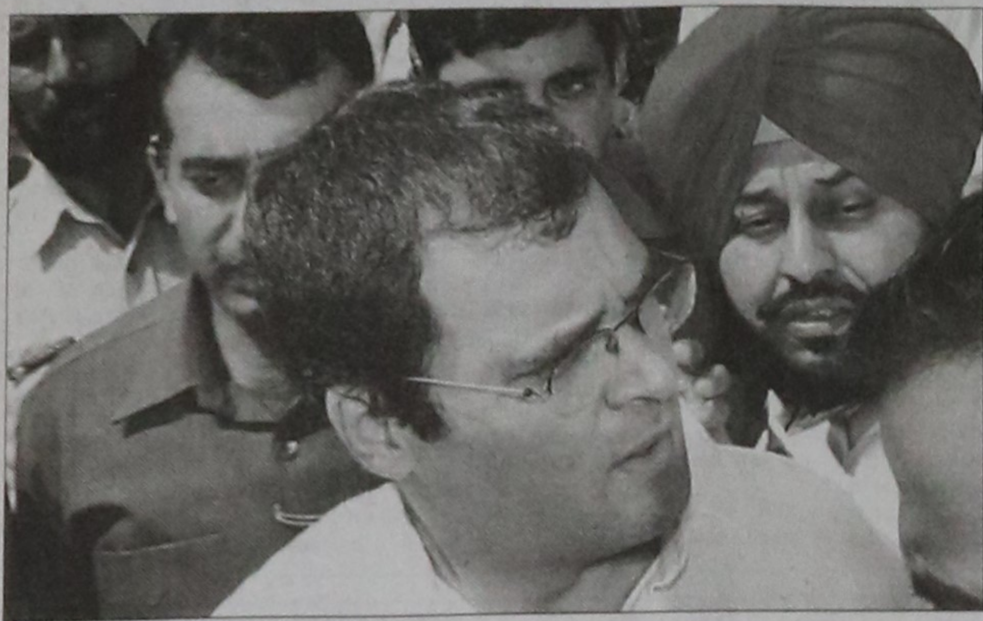
Indian Congress Party General Secretary Rahul Gandhi arrives at the railway station in Ludhiana on Tuesday. Rahul travelled from New Delhi to Ludhiana by the Swarn Shatabdi Express, joining his party's austerity drive.