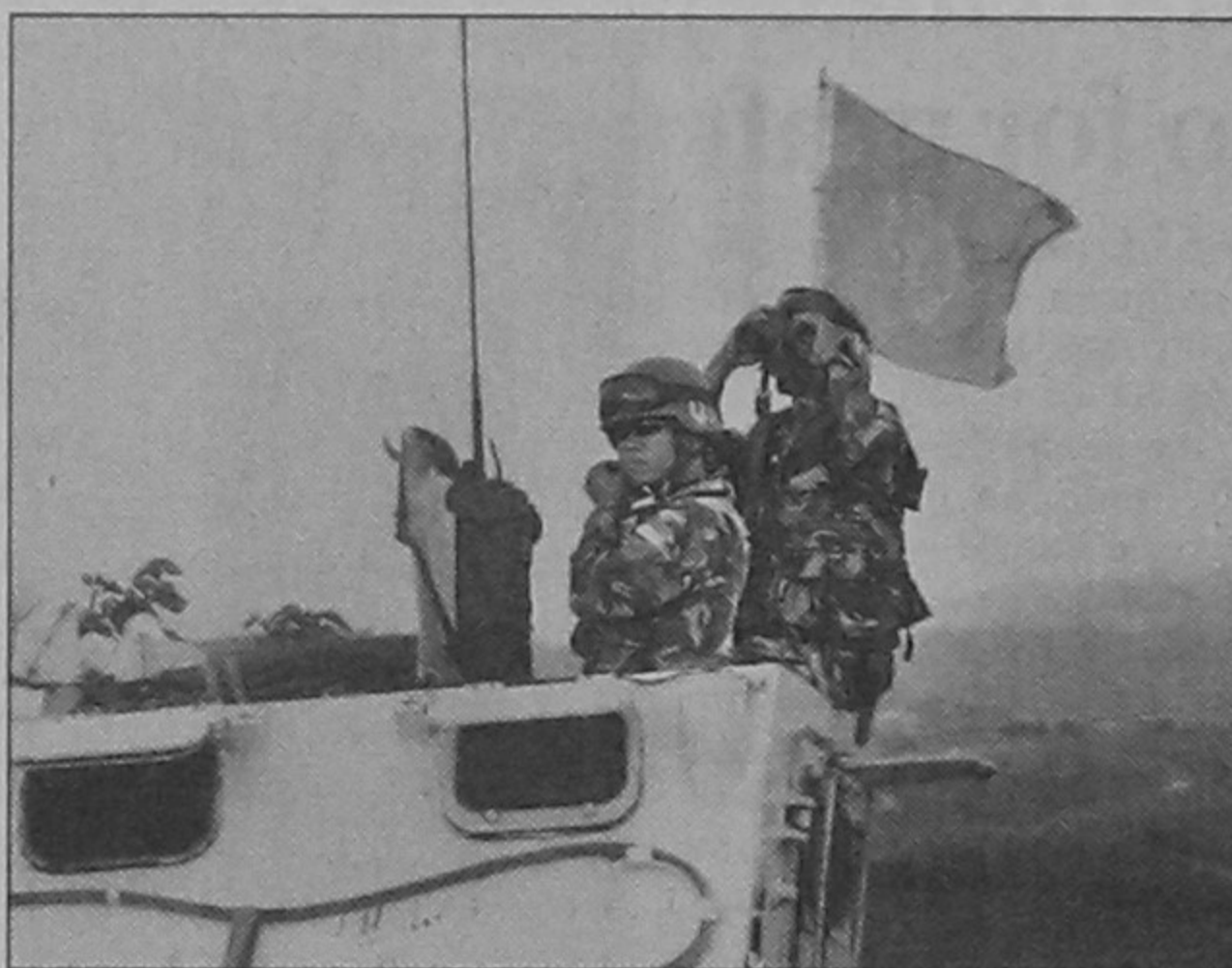
Two Indonesian UN peacekeepers monitor the border area between Lebanon and Israel from the southern Lebanese village of Adaiseh on Saturday. UN peacekeepers were monitoring the Lebanese border with Israel, a day after rockets launched from south Lebanon slammed into Galilee, but the situation was "calm," a spokeswoman said.

Iran says its nuclear drive is solely aimed at generating electricity for its growing population.