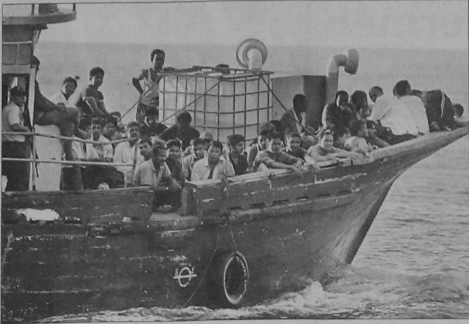
A group 80 illegal immigrants, who were rescued by Salvadorean coast guards, are taken to disembark at Acajutla Port in the department of Sonsonate, 84 km southwest of San Salvador on Saturday.