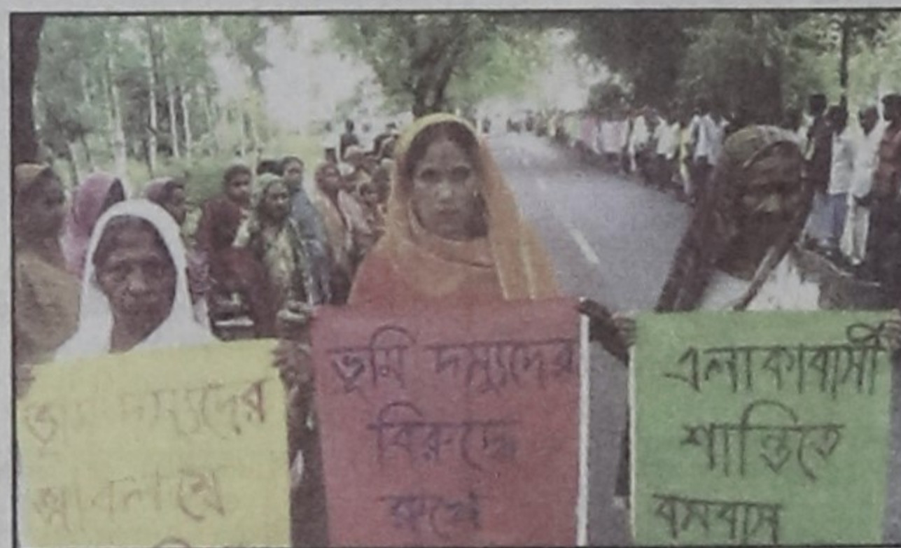
Locals form a human chain on Gobindganj-Ghoraghat Road in Gaibandha district yesterday demanding action against extortionists and land grabbers at Nesarabad and Melakabad villages in Gobindganj upazila.

The settlers earlier appealed several times to the upazila administration to take steps in this regard but to no effect, they said.