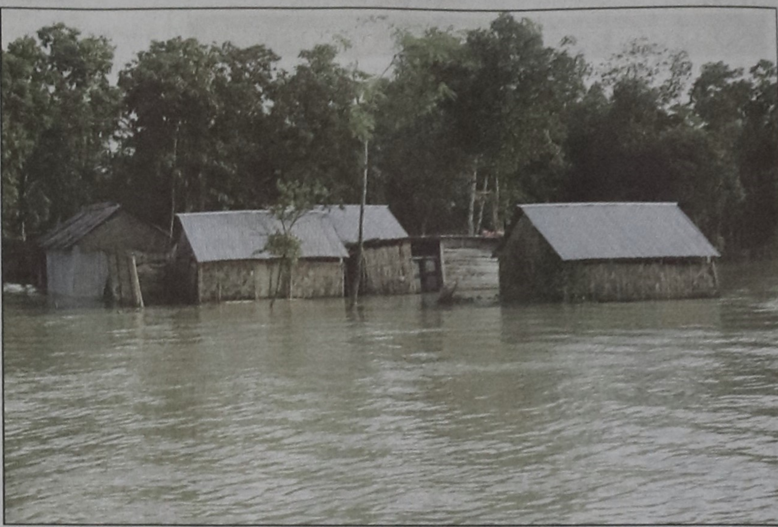
Dwelling houses in Maizbari village under Kazipur upazila of Sirajganj district go under water as the rain-fed Jamuna River flooded large areas of Kazipur, Shahzadpur, Chowhali, Belkuchi and Sadar upazilas under the district, forcing about 5,000 people to move for safer places and making 20,000 others marooned.