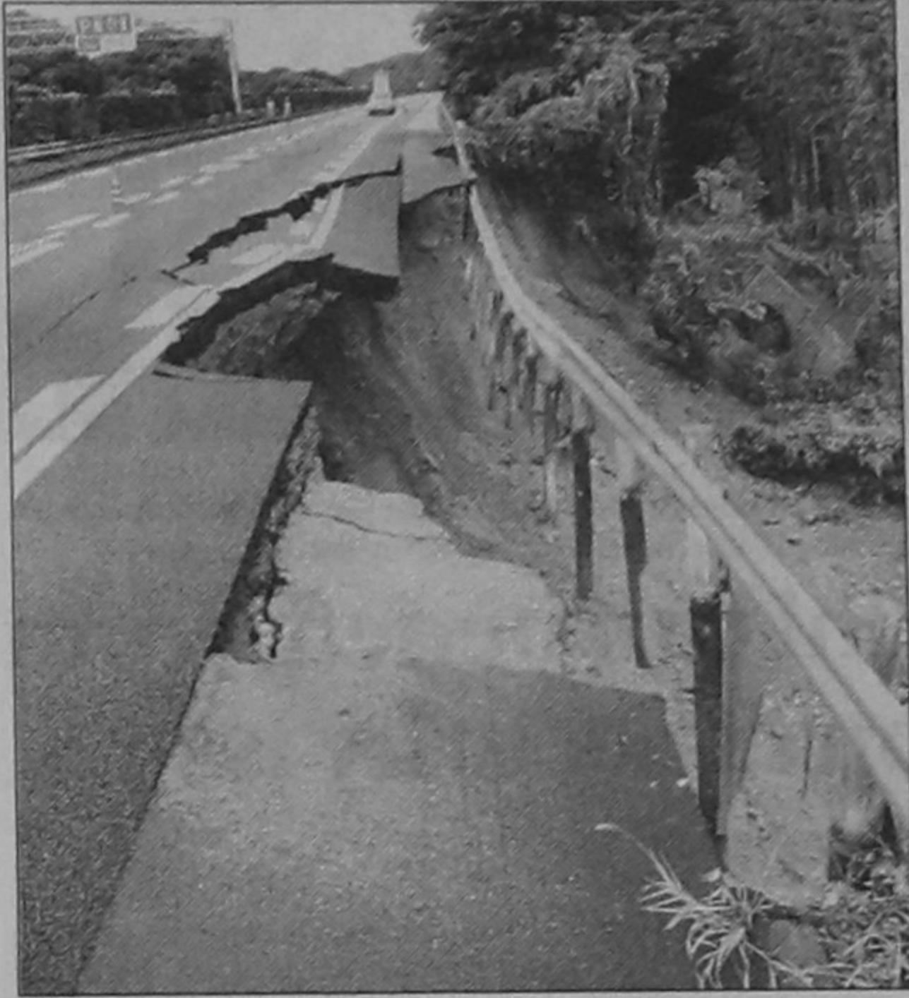
A picture shows a collapsed section of the Tomei Expressway in Makinohara, some 200km west of Tokyo, after a strong earthquake rocked Japan yesterday.

metres, according to the US Geological Survey. One person was killed and several dozen injured when the 6.5-magnitude quake hit Tokyo and nearby areas shortly after dawn Tuesday, halting trains and forcing two nuclear reactors to shut down for safety checks. Police said one 43-year-old woman was killed by falling debris and at least 100 people were injured. Japan's public broadcaster, NHK, reported that more than 80 people suffered minor injuries. Seven more people were injured in Tokyo and in Kanagawa and Aichi prefectures, said the National Police Agency.