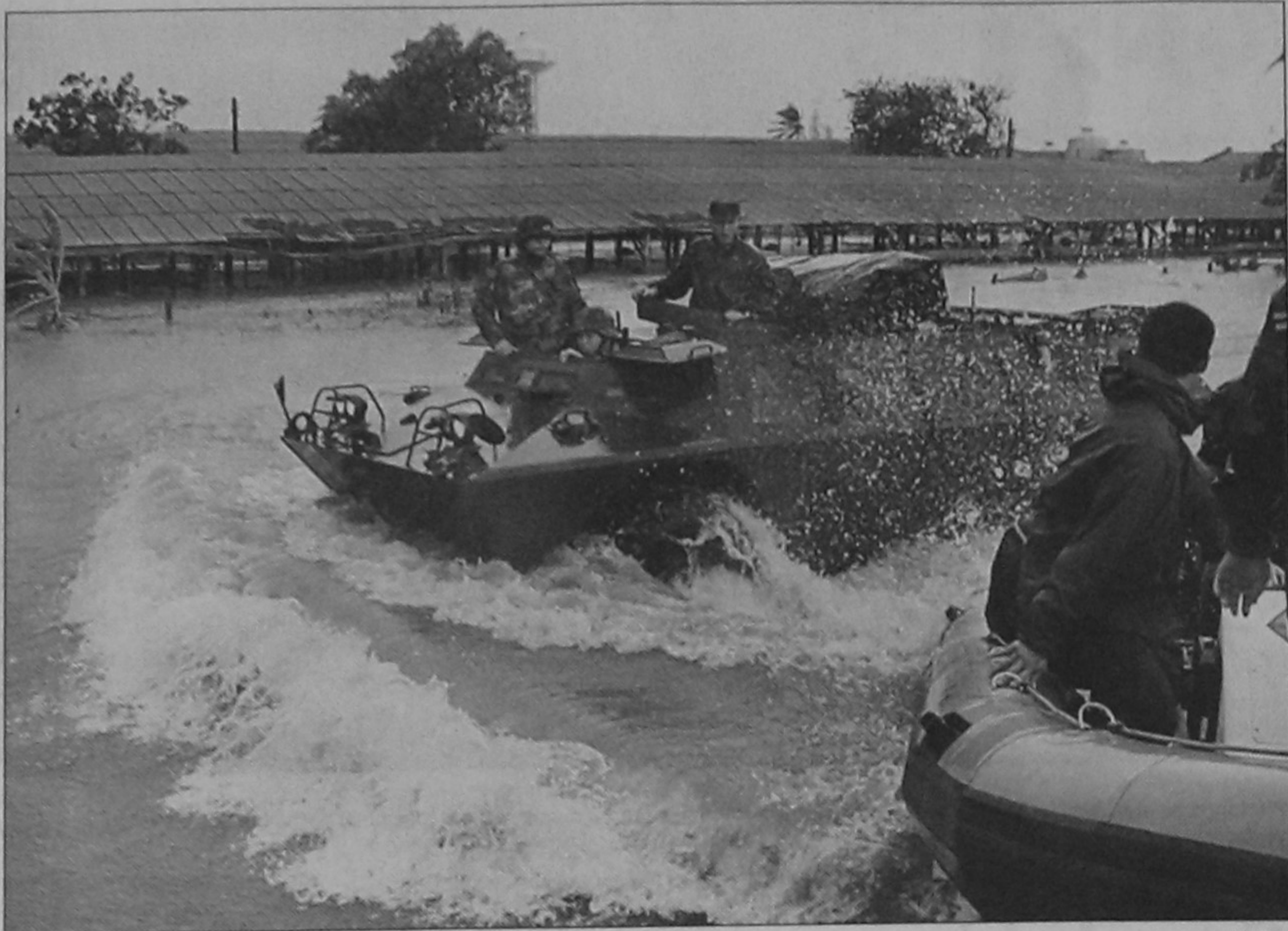
Handout photo from Taiwan Military Agency shows military troop searching for survivors in Hsuahchia, Tainan county, southern Taiwan yesterday, following heavy flooding caused by Typhoon Morakot.