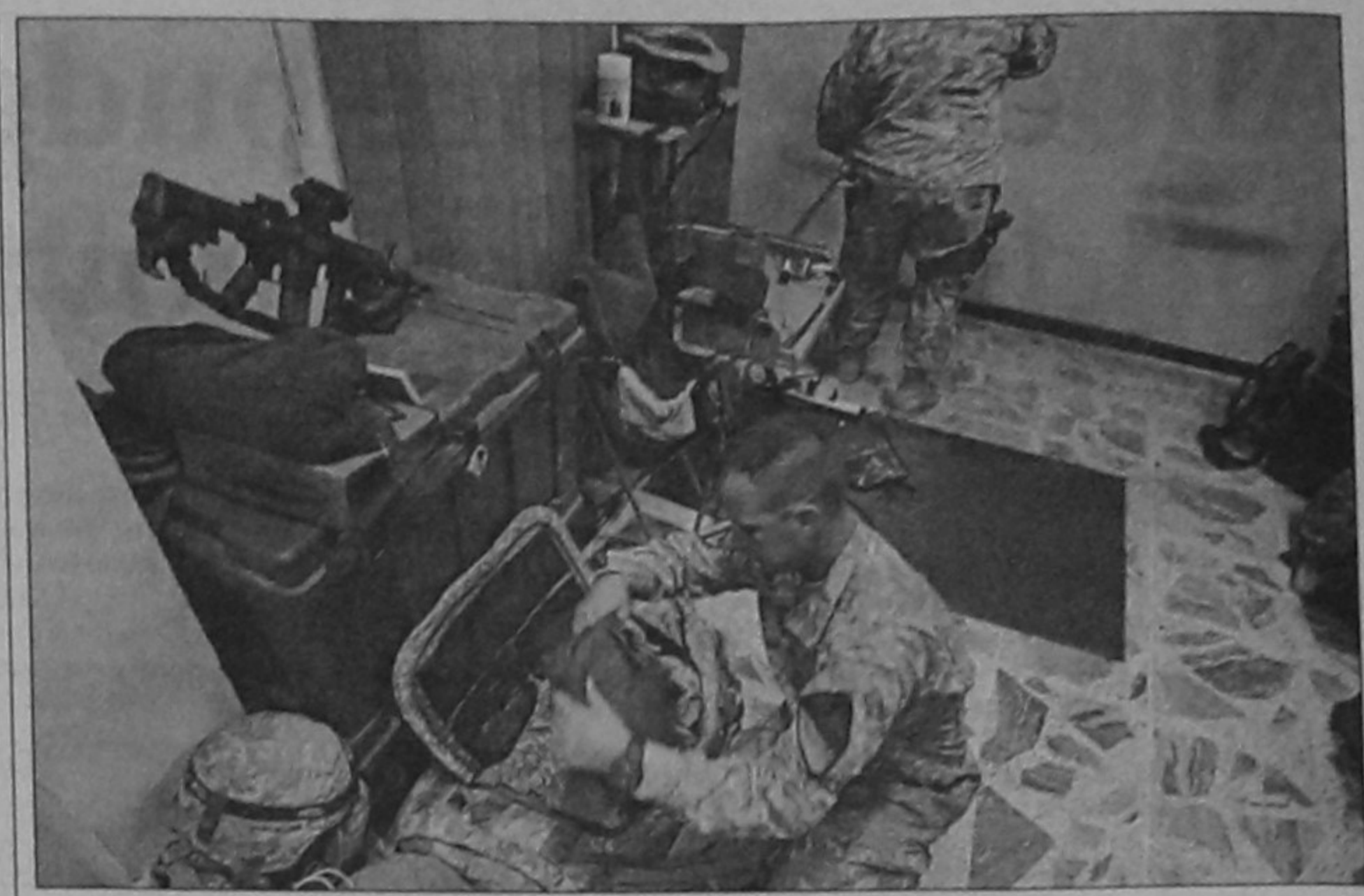
AUS soldier of Company C, 2nd Battalion, 5th Cavalry Regiment, 1st Cavalry Division, packs his bags as another sweeps the floor at their barracks in the Joint Security Station (JSS) Comanche base south of the Sadr City district in Baghdad yesterday. The Iraqi Ministry of Agriculture will be taking over the base following the June 30 deadline for US forces to pull out of Iraq's urban centers.