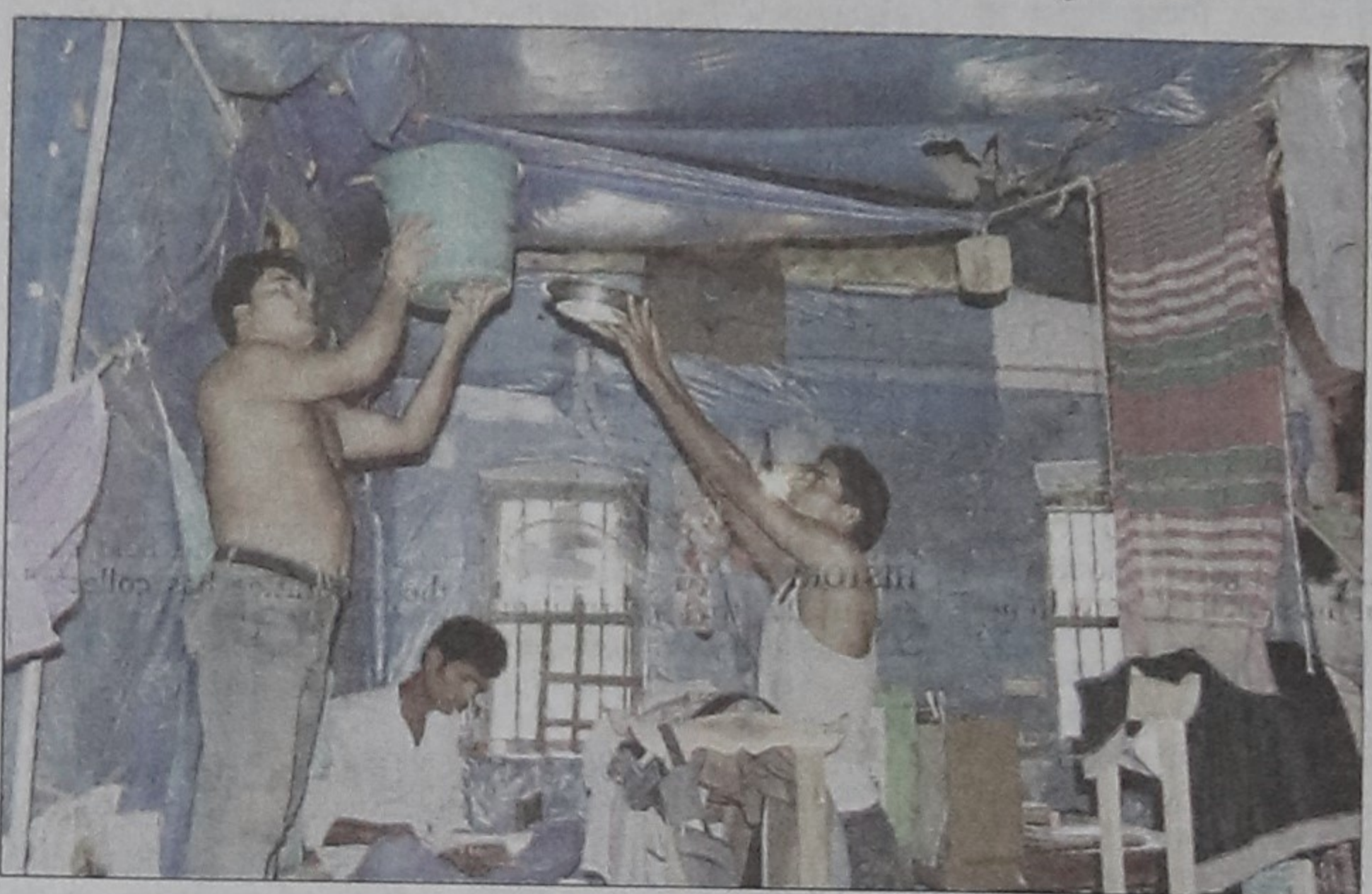
Resident students trying to get rid of rainwater seeping through the roof of decrepit Jibanananda Das Hostel of BM College in Barisal.

authorities concerned about the situation but to no effect. Major accidents may occur at any moment if the buildings are not renovated or repaired on an urgent basis."