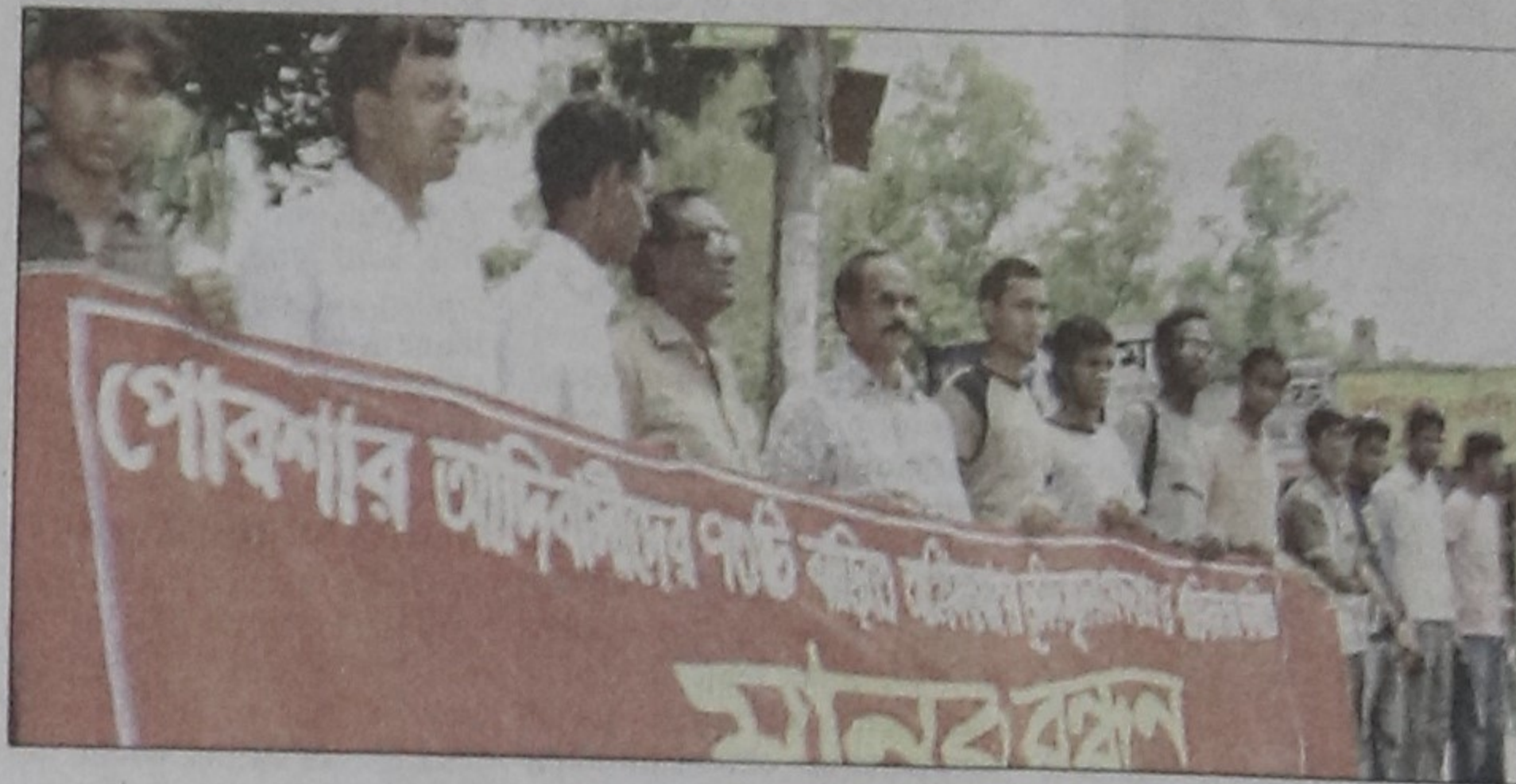
Adivasi Chhatra Parishad forms a human chain at Kazi gate of Rajshahi University yesterday demanding punishment to the perpetrators who evicted 74 indigenous families in Naogaon on June 13.