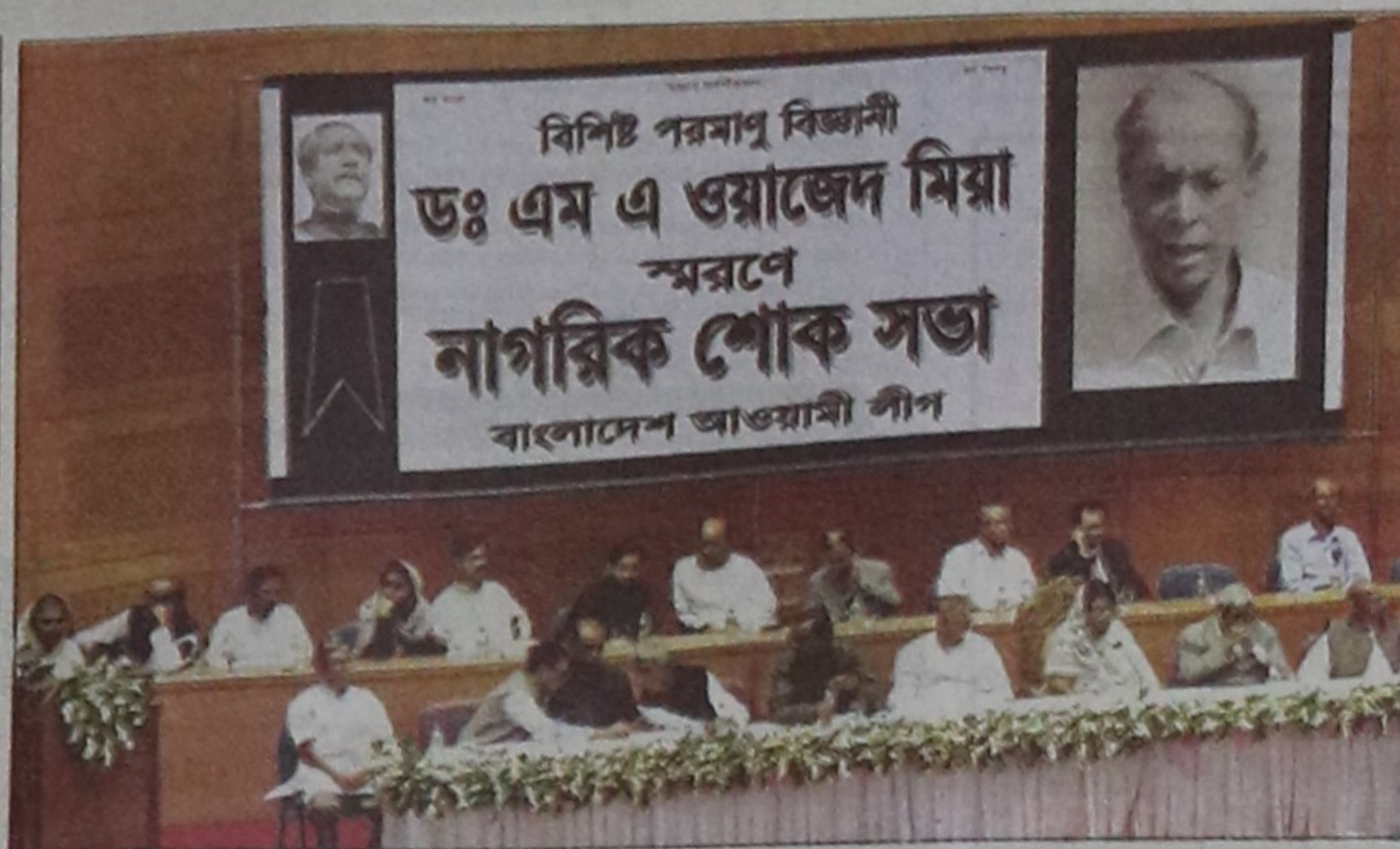
Participants at a civic condolence meeting in memory of Dr Wazed Miah, an internationally renowned nuclear scientist and the husband of Prime Minister Sheikh Hasina. Awami League organised the event at Bangladesh-China Friendship Conference Centre in the city yesterday. (Story on Page 2)

The Dalit families also demanded their security, compensation for the loss and an investigation into the attacks.