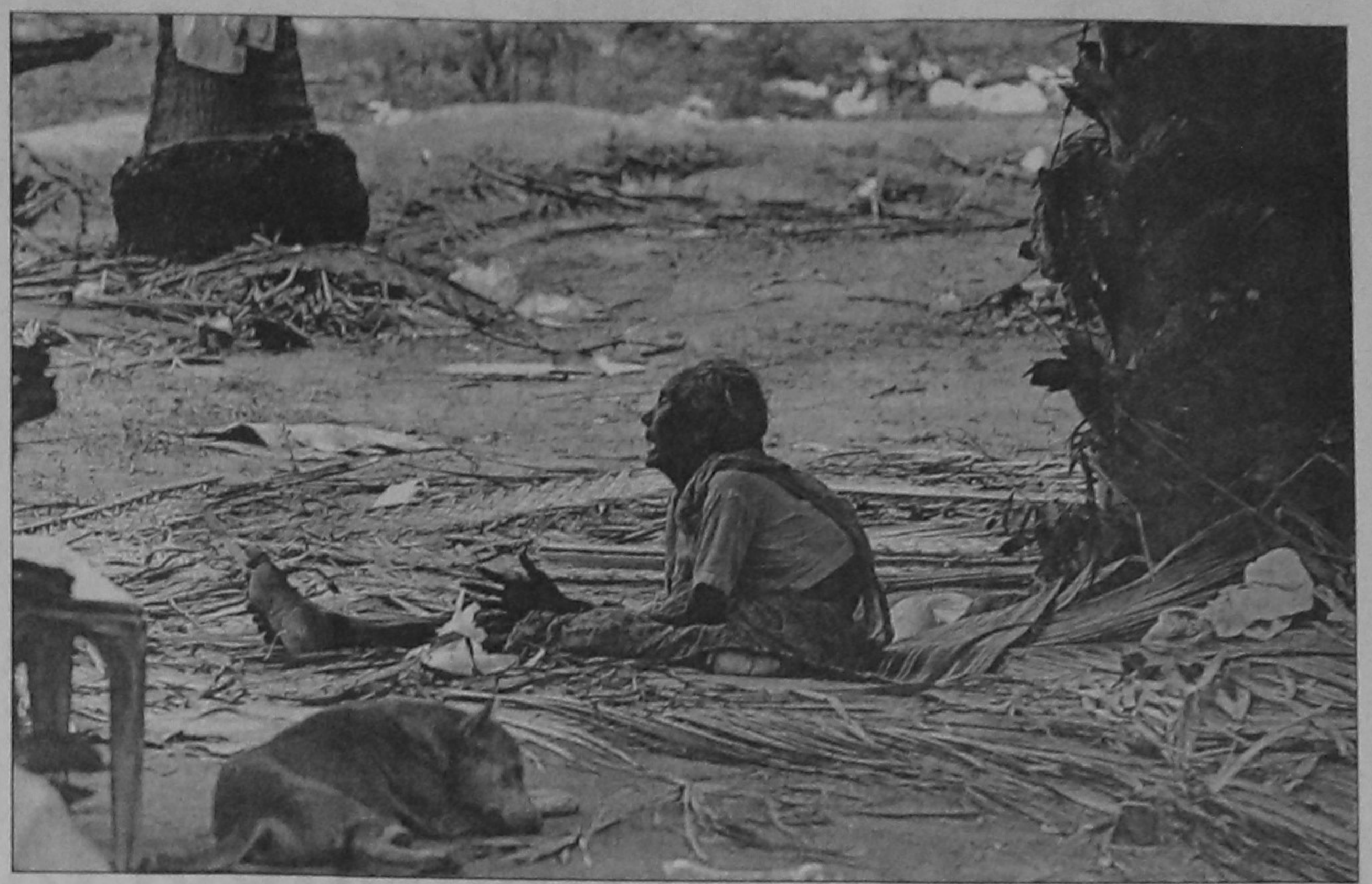
An elderly Sri Lankan Tamil civilian sits among the rubble of a village near Puthukkudiyiruppu on Friday. The Sri Lankan army has made steady advances in recent days against the separatist Liberation Tigers of Tamil Eelam (LTTE), slowly beating back the guerrillas.

The UN says nearly 6,500 civilians have been killed in the fighting over the past three months. The rebels, listed as a terror group by many Western nations, have been fighting since 1983 for an ethnic Tamil state in the north and east after decades of marginalisation by governments dominated by the Sinhalese majority.