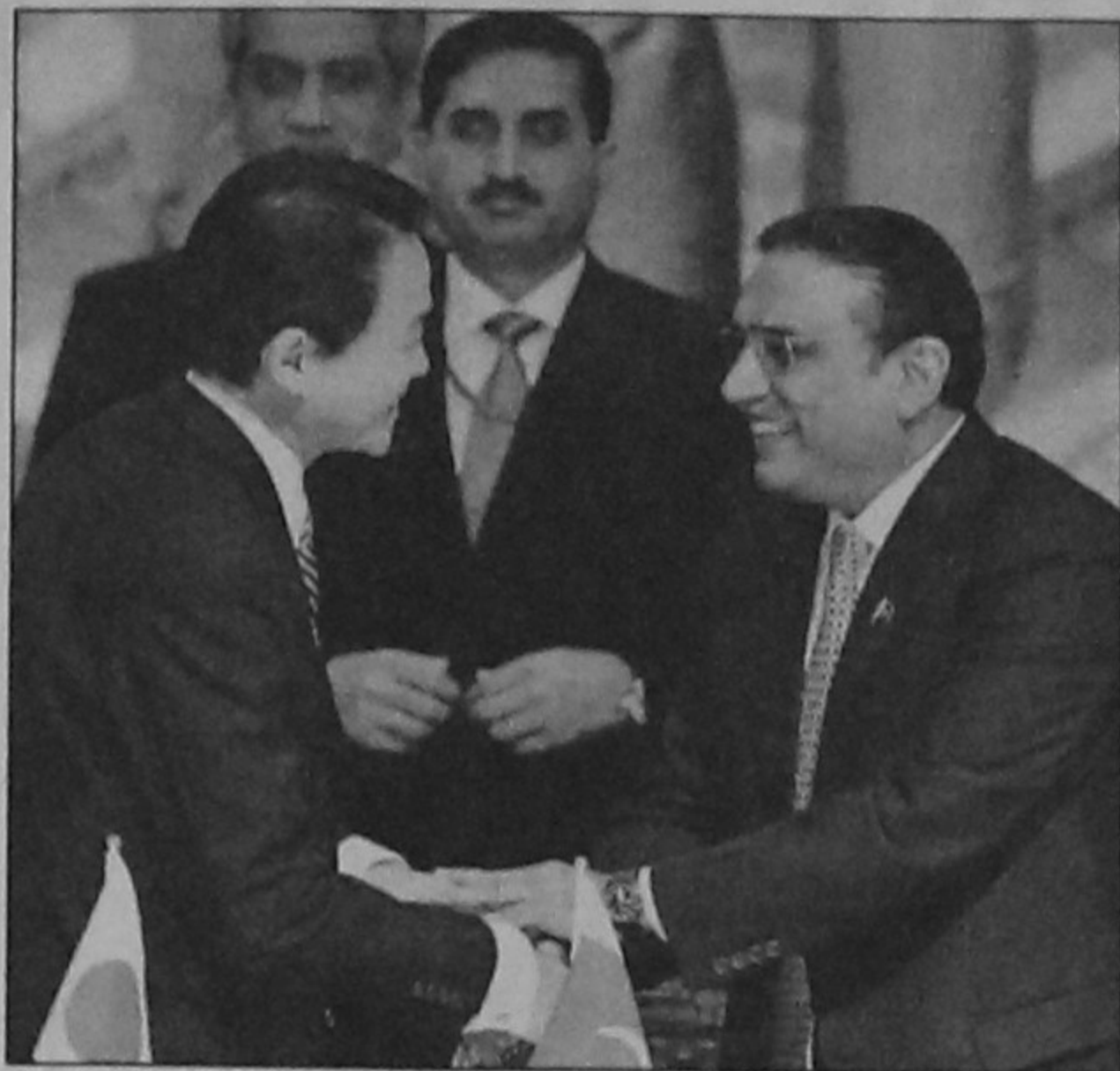
Pakistani President Asif Ali Zardari (R) shakes hands with Japanese Prime Minister Taro Aso (L) after he delivered his opening speech at the conference of Pakistan's donors in Tokyo yesterday.

reporters. But he said a lasting peace would only come "through a political solution that addresses the legitimate aspirations of all Sri Lankan communities." Sri Lanka said Thursday it had made fresh advances into an area still held by the Tiger rebels, who launched a campaign in 1972 to create a separate homeland on the island for the Tamil minority. Civilians -- estimated at more than 140,000 by the United States and more than 100,000 by the United Nations -- are holed up in the narrow strip on the northeastern coast initially designated a safe zone.