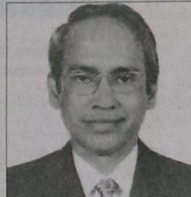
New addl MD for Uttara Bank

He said the government is working hard to bring back the golden period of the jute and soon a policy will be announced.