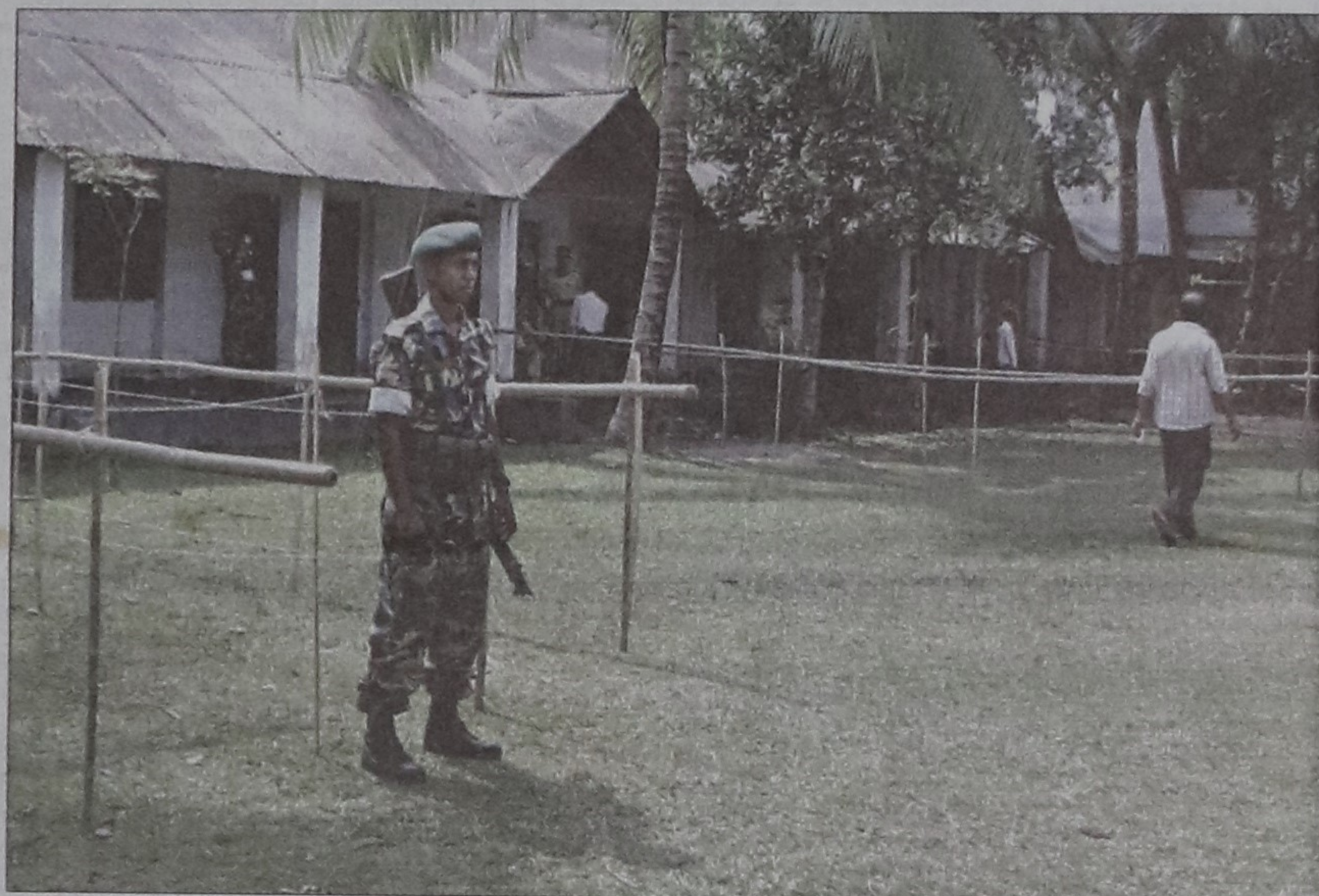
Ansar members and policemen stand guard at Robertsonsganj High School polling centre in Rangpur yesterday afternoon. The centre witnessed a very poor turnout in the by-election.