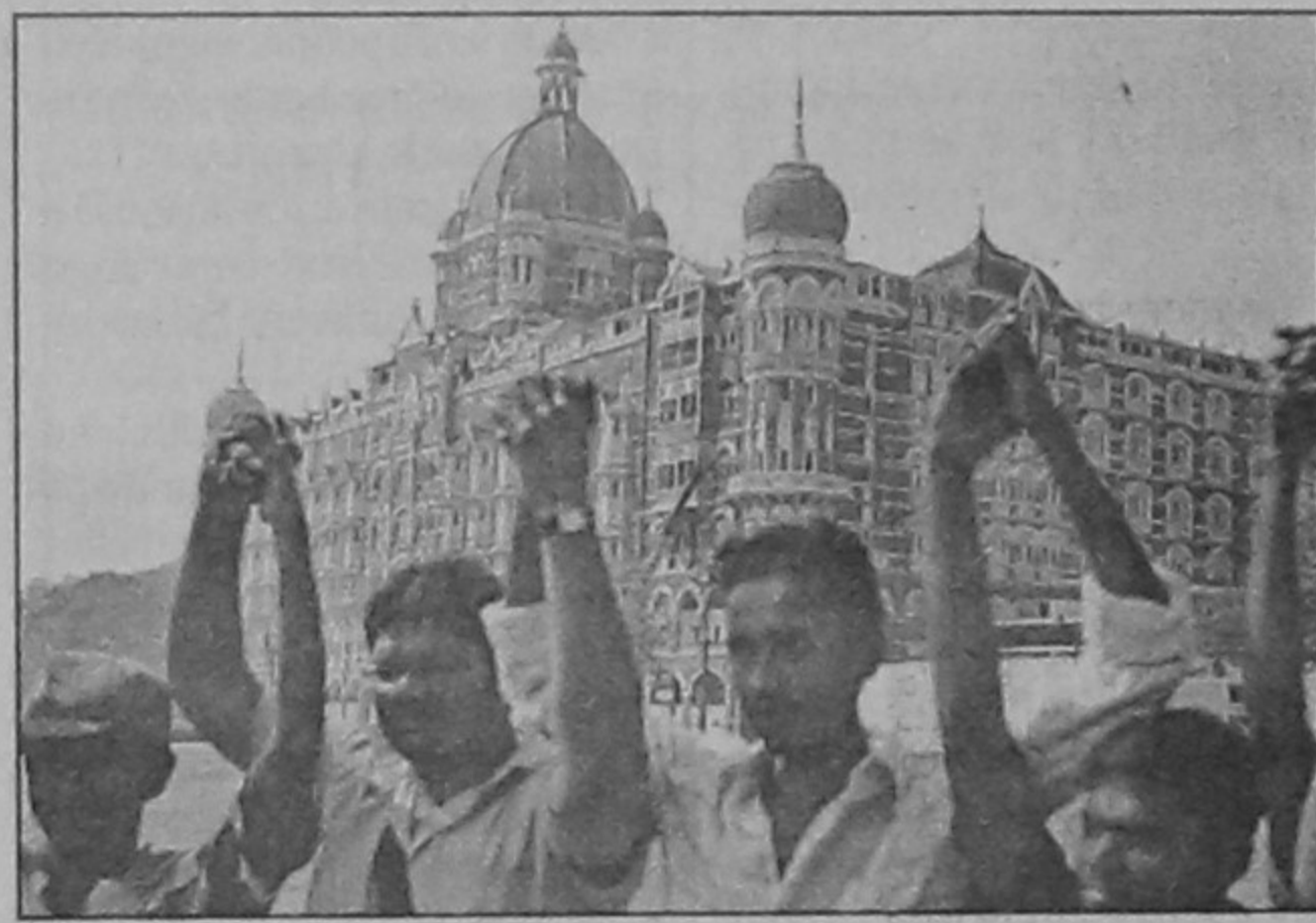
Thousands of Indians form a human chain outside the Taj Hotel, one of several landmarks attacked by militants, during a peaceful demonstration of solidarity in Mumbai yesterday.

The prime minister admitted that the Mumbai terror attacks exposed gaps in the country's security and intelligence system. "The Mumbai incident has highlighted gaps in our preparedness to deal with these kinds of assaults. We need to equip ourselves more effectively to deal with this unprecedented threat and challenge to our country's integrity and unity".