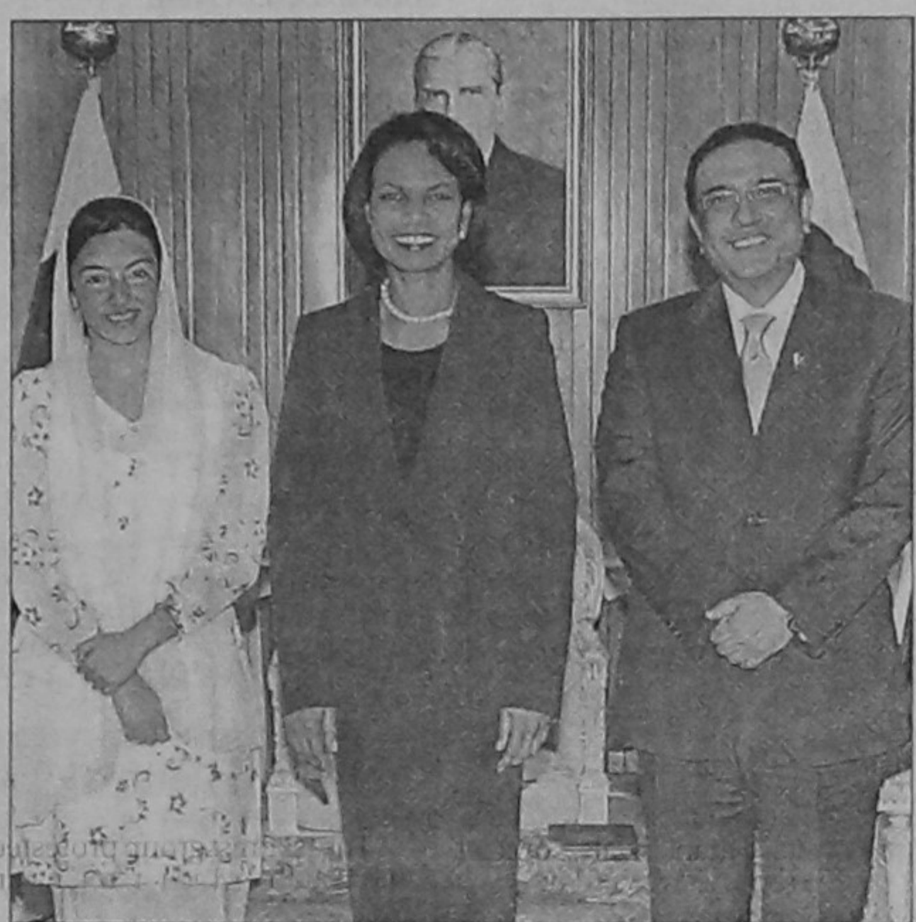
Hand out picture shows US Secretary of State Condoleezza Rice (C), Pakistani President Asif Ali Zardari (R) and his daughter Aseefa Bhutto (L) posing for photographs after a meeting in Islamabad yesterday. Pakistan promised that it would take "strong action" against anyone on its territory found to have been involved in the Mumbai attacks.

Attractive compensation will be offered to the deserving candidate. Interested candidates are requested to send their updated resume along with photocopies of all educational / professional certificates and two recent passport size photographs on or before December 21, 2008 to the following address: Post Box # 216, C/O- GPO, Dhaka-1000 . The position applied for should be marked on top of the envelope.