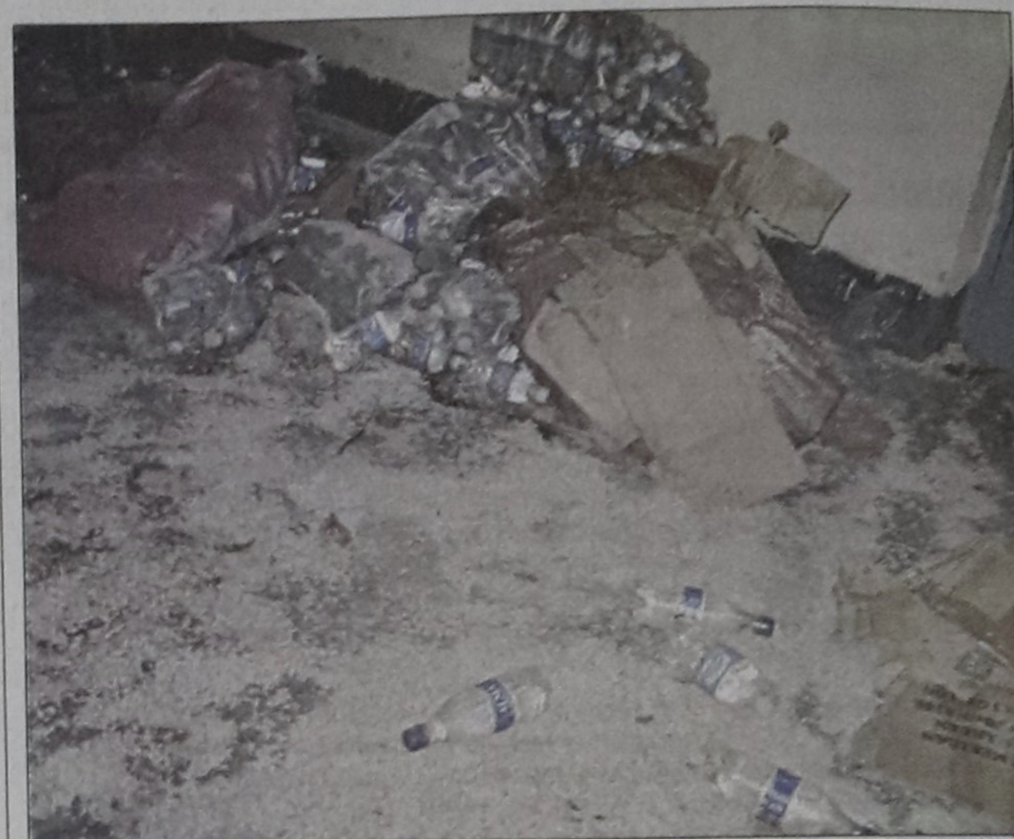
Left undistributed for around a year, relief materials meant for Sidr victims got damaged in a room of Dumki Upazila Complex building in Patuakhali.