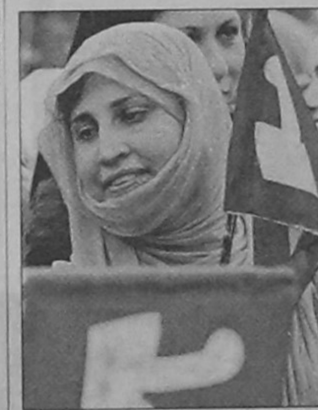
Supporters of Indian administered Kashmir's National Conference (NC) party look on during an election rally on the outskirts of Srinagar yesterday.