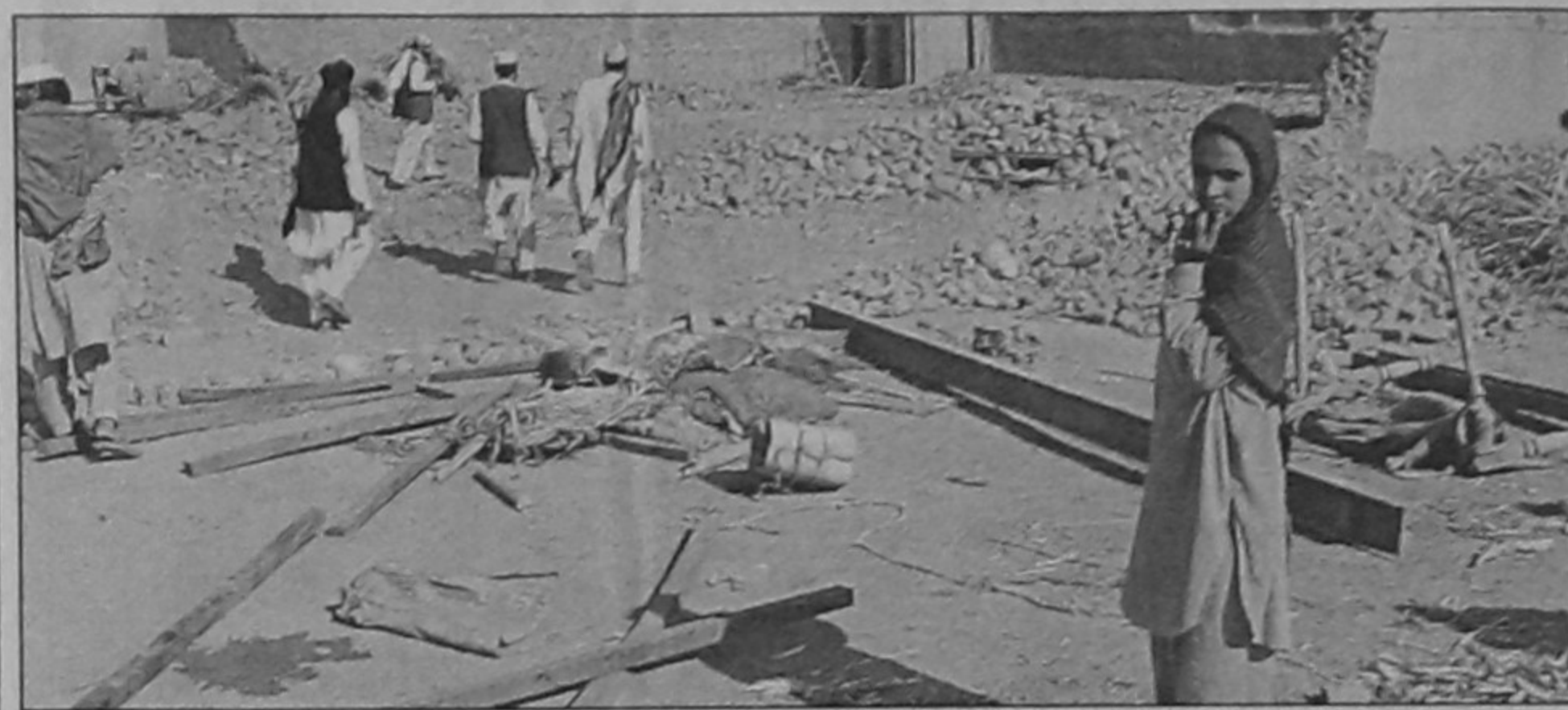
Pakistani tribal people stand among the debris of houses after a suspected US airstrike in the Jani Khel area of the country's Northwestern Bannu district yesterday. A missile strike by a suspected US drone killed at least six people including foreigners in northwest Pakistan near the Afghan border.

He hailed the cooperation developing between the United States and the Pakistan military as a major success.