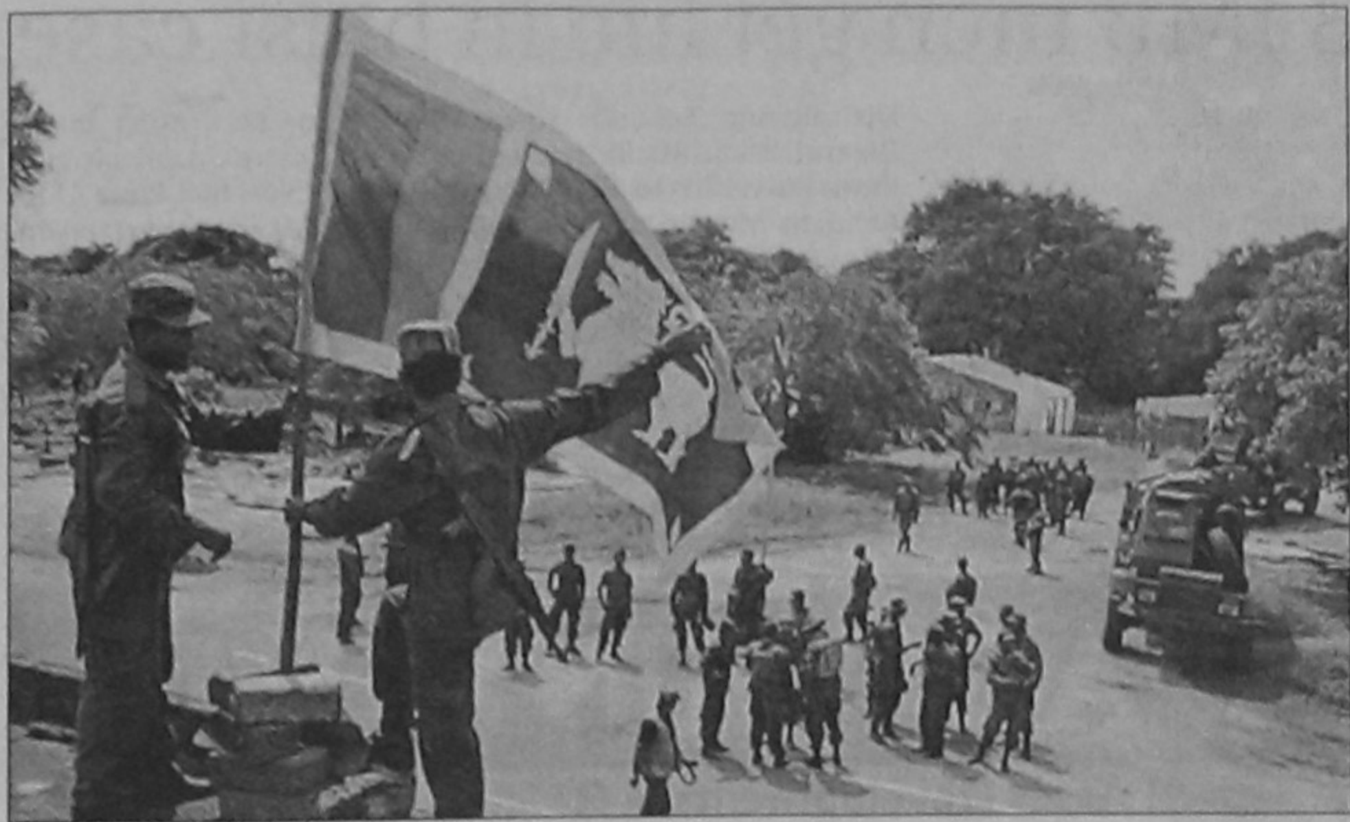
This Sri Lankan Defence Ministry handout picture taken on Tuesday shows government soldiers erecting the national flag after troops captured the northern town of Mankulam from the Tamil Tigers. Tiger rebels said yesterday they were beating back a new push into their territory by government troops as heavy fighting raged across the island's north.