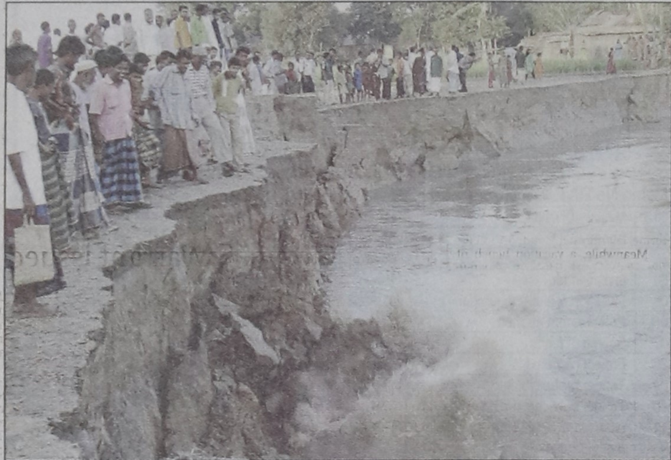
People give a bleak look at the threatened embankment at Chiniripatal village in Saghata upazila as Jamuna River, already devouring vast lands in Saghata and Fulchhari upazilas, continues to erode the area.

Bangladesh should return to its non-communal, democratic and discrimination-free foundations by defeating harmful activities of the evil communal forces, Menon said.